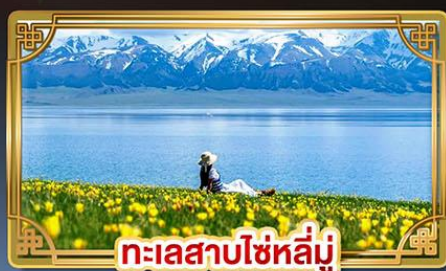
ทะเลสาบไซหลี่มู่