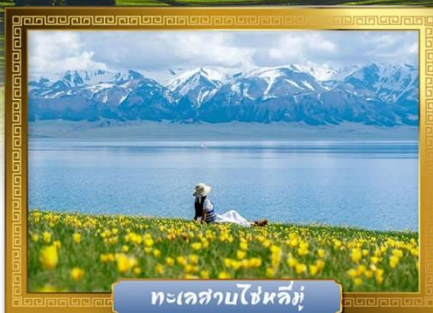
ทะเลสาบไซหลิมู่