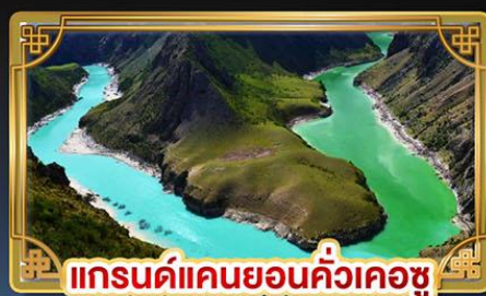
แกรนด์แคนยอนคั่วเคอซู