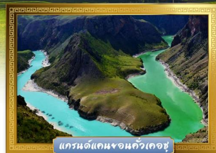
แกรนด์แคนยอนคั่วเคอซู

เดินทางโดย : สายการบินโซนาเซาเทิร์นแอร์ไลน์