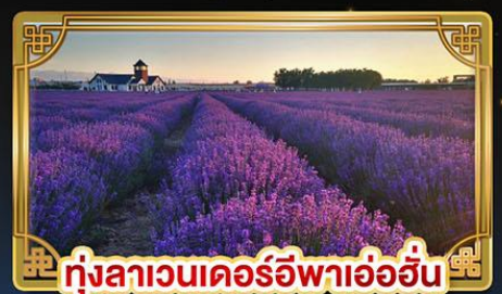
ทุ่งลาเวนเดอร์อี้พาอ้อฮั่น