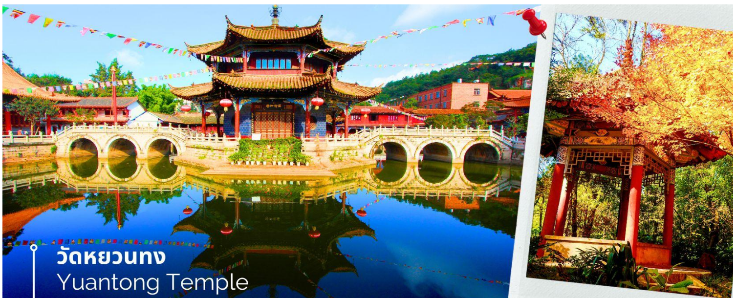
วัดหยวนทอง Yuantong Temple

เช้า 🍽️ รับประทานอาหารเช้า ณ ห้องอาหารโรงแรม (15) นำท่านชม วัดหยวนทอง (Yuantong Temple) วัดแห่งนี้เป็นวัดที่ใหญ่และเก่าแก่ที่สุดในเมืองคุนหมิง สร้างมาตั้งแต่สมัยราชวงศ์ถัง มีอายุยาวนานประมาณ 1,200 กว่าปี การสร้างวัดแห่งนี้จะแปลกตากว่าวัดอื่นในจีน เพราะปกติแล้วการสร้างวัดของจีนส่วนมากจะต้องสร้างอยู่บนภูเขา แต่วัดหยวนทองสร้างวัดต่ำกว่าภูเขา โดยวิหารจะอยู่ต่ำที่สุดเนื่องจากวัดแห่งนี้ไม่ได้สร้างขึ้นเพื่อเป็นวัดโดยตรง แต่เคยเป็นศาลเจ้าแม่กวนอิมมาก่อน