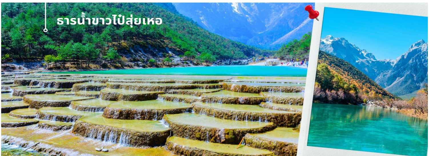
ธารน้ำขาวไปสู่เหอ

นำท่านชม ธารน้ำขาวไปสู่เหอ หรือ ทะเลสาบไปสู่เหอ (รวมค่าบริการรถแบตเตอรี่) ทะเลสาบสีเทอร์ควอยซ์ตัดกับวิวต้นไม้ ท่ามกลางขุนเขาแห่งหุบเขาพระจันทร์สีน้ำเงิน ฉากของภูเขาหิมะมังกรหยก มีน้ำตกหินปูนชั้นบันไดขนาดเล็กกลดหล่นลงมาอย่างสวยงาม น้ำที่ไหลผ่านหุบเขานี้คือน้ำที่ละลายจากหิมะบนยอดเขาหิมะมังกรหยก เนื่องจากจุดนี้มีทิวทัศน์ที่สวยงามมีฉากหลังคือภูเขาหิมะมังกรหยกมีน้ำตกและแม่น้ำกึ่งทะเลสาบจึงเป็นที่นิยมของนักท่องเที่ยวช่างภาพและคู่รักเป็นอย่างมาก อิสระเก็บภาพประทับใจตามอัธยาศัย