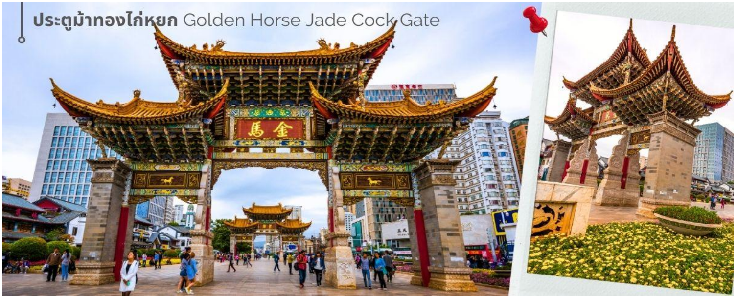
ประตูม้าทองไก่หยก Golden Horse Jade Cock Gate

ค่า 🍽️ รับประทานอาหารค่ำที่ภัตตาคาร (14) 🏨 เดินทางเข้าที่พัก LONGWAY HOTEL ระดับ 4 ดาวหรือเทียบเท่า