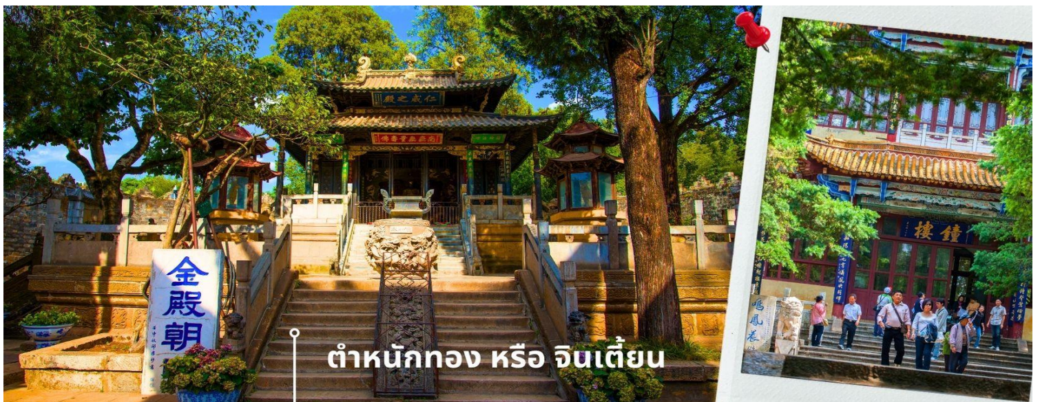
ตำหนักทอง หรือ จินเตี้ยน

นำท่านเยี่ยมชม ตำหนักทอง หรือ จินเตี้ยน (The Golden Temple Park | Jindian park) (ไม่รวมค่ารถ แบตเตอรี่ 15 หยวน/ท่าน) โบราณสถานสำคัญของมณฑลยูนนาน ที่ได้รับการปกป้องดูแลโดยรัฐบาลจีน ตั้งอยู่บริเวณ เชิงเขาหมิงเฟิง ล้อมรอบด้วยแนวกำแพงและหอคอยเหมือนเป็นป้อมปราการ ตำหนักทองถูกเรียกตามลักษณะอาคารที่ มีสีทองอร่าม จากทองเหลืองในส่วนของผนังและหลังคา รวมกว่า 200 ตัน โดยถือเป็นสิ่งปลูกสร้างด้วยสัมฤทธิ์ที่ใหญ่ ที่สุดของจีน ภายในมีรูปปั้นทองโดยมีเงินอยู่ (เสวียนอยู่) เทพเจ้าลัทธิเต๋าเป็นองค์ประธาน