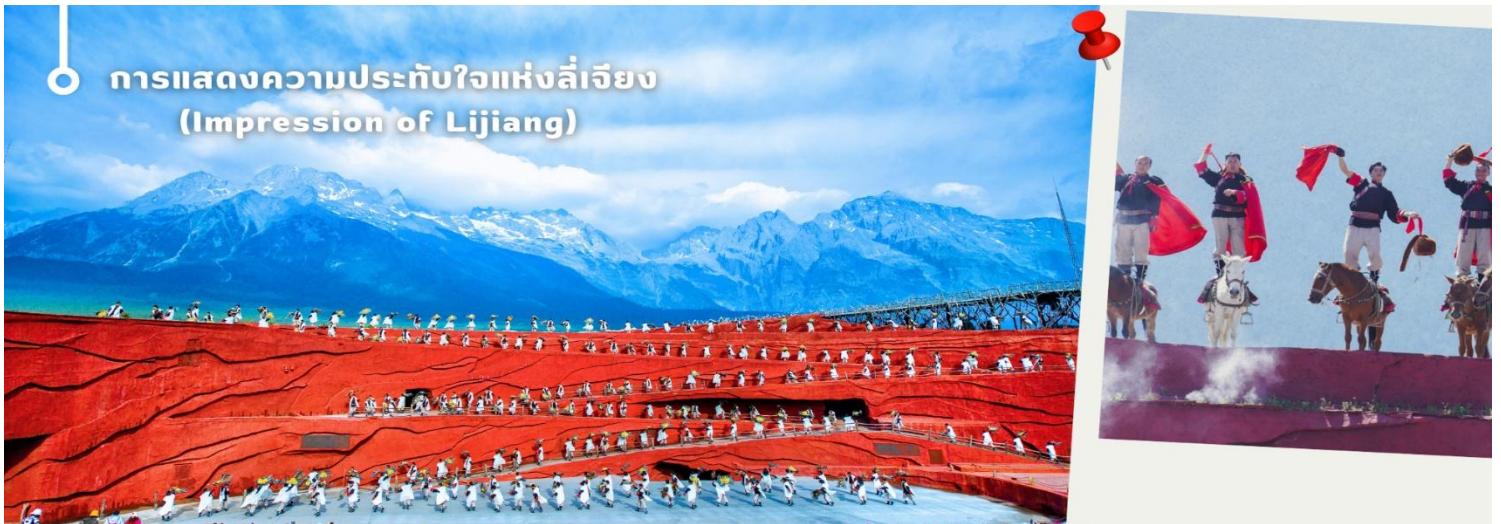
การแสดงความประทับใจแห่งลี่เจียง (Impression of Lijiang)

และที่ไม่ควรพลาดนั่นคือ การแสดงความประทับใจแห่งลี่เจียง (Impression of Lijiang) การแสดงที่คัดเลือกนักแสดงชนเผ่าท้องถิ่นกว่า 500 ชีวิต มาร่วมกันร้อง เล่น เต้นรำ และบอกเล่าวิถีชีวิตของชาวนาซี (naxi) ชาวพื้นเมืองของลี่เจียง ที่มีความเชื่อว่าพวกเขาคือลูกหลานของสวรรค์และธรรมชาติอันยิ่งใหญ่ ด้วยบรรยากาศเมฆสวย ฟ้าใส รวมเข้ากับดนตรีพื้นเมืองและการแสดงที่เป็นเอกลักษณ์ได้อย่างลงตัว ซึ่งกำกับการแสดงโดยจางอี้โหมว ผู้กำกับฝีมือเยี่ยมมีชื่อเสียงก้องโลก ซึ่งจางอี้โหมว ได้เนรมิตเวทีการแสดงกลางแจ้งขึ้นมาบนความสูงกว่า 3,000 เมตร เหนือระดับน้ำทะเล โดยมี “ภูเขาหิมะมังกรหยก” เป็นฉากหลังสุดอลังการ