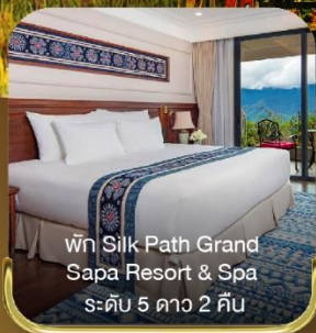
พัก Silk Path Grand Sapa Resort & Spa ระดับ 5 ดาว 2 คืน