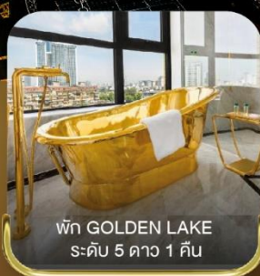
พัก GOLDEN LAKE ระดับ 5 ดาว 1 คืน