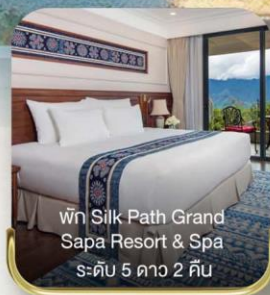
พัก Silk Path Grand Sapa Resort & Spa ระดับ 5 ดาว 2 คืน