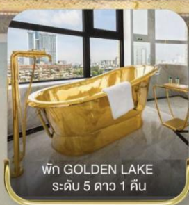
พัก GOLDEN LAKE ระดับ 5 ดาว 1 คืน