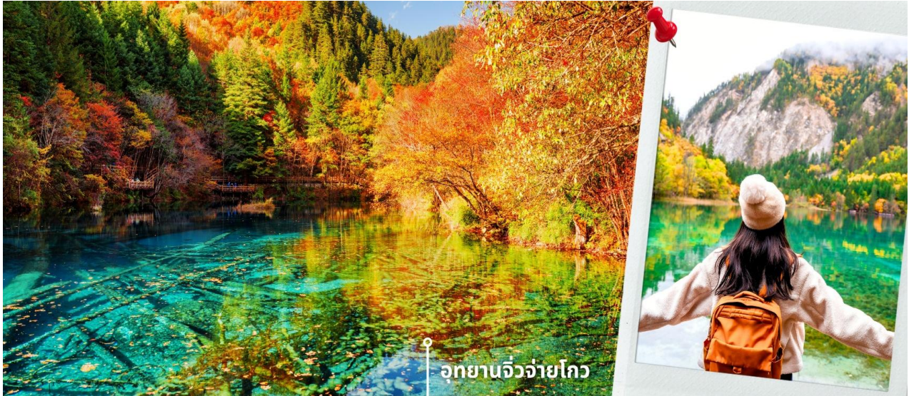
อุทยานจิ่วจ้ายโกว

1.ทะเลสาบยาว (Long Lake) ทะเลสาบที่ใหญ่ที่สุด สูงที่สุด และลึกที่สุดในจิ่วจ้ายโกว ด้วยเนื้อที่กว่า 581 ไร่ ความยาวกว่า 7 กิโลเมตร และลึกถึง 103 เมตร ทอดตัวโค้งเป็นรูปพระจันทร์เสี้ยว เนื่องจากหิมะบนภูเขาละลายลงมา น้ำในทะเลสาบสีฟ้าสวยงาม ล้อมรอบด้วยยอดเขาสูงชัน และต้นไม้เขียวใหญ่ที่ปกคลุมด้วยหิมะ งดงามราวหลุดออกมาจากภาพวาด ความพิเศษในช่วงฤดูหนาว ทะเลสาบจะกลายเป็นน้ำแข็งหนากว่า 60 เซนติเมตร ทำให้นักท่องเที่ยวนิยมมาเล่นสเก็ตน้ำแข็งกันเป็นจำนวนมาก