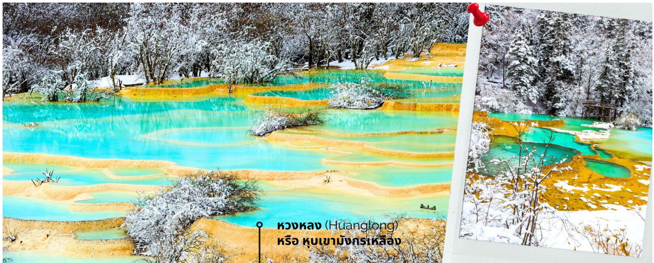
หวงหลง (Huanglong) หรือ หุบเขามังกรเหลือง

**ระยะเวลาการเปลี่ยนสีของใบไม้ และการตกของหิมะขึ้นอยู่กับสายพันธุ์และสภาพอากาศ**