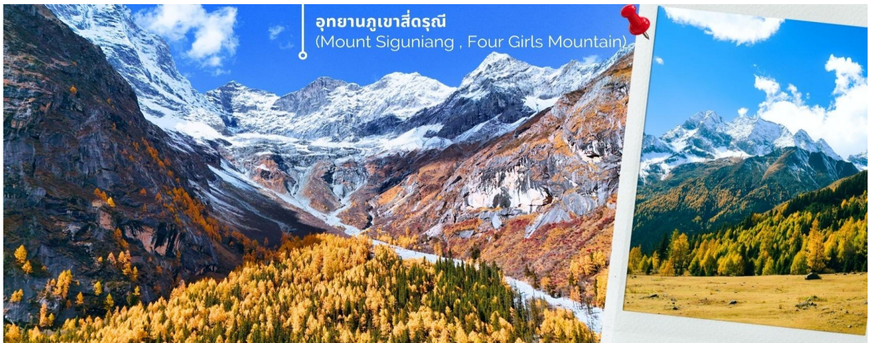
อุทยานภูเขาสี่ดรุณี (Mount Siguniang , Four Girls Mountain)

นำท่านเดินทางสู่ อุทยานภูเขาสี่ดรุณี (Mount Siguniang หรือ Four Girls Mountain) หรือชื่อเรียกในภาษาจีนว่า 'ชื่อภูเขา' (เดินทางใช้เวลาเดินทางประมาณ 3-4 ชั่วโมง) อยู่สูงกว่าระดับน้ำทะเลราว 5,000 เมตร ตั้งอยู่ในอำเภอเสี่ยวจิน เขตปกครองตนเองชนชาติทิเบตและเชียงอาปา มณฑลเสฉวนทางตะวันตกเฉียงใต้ของจีน ห่างจากนครเฉิงตูราว 220 กิโลเมตร เป็นส่วนหนึ่งของอุทยานฉางผิง ชาวทิเบตเรียกขานกันในนามเทพศักดิ์สิทธิ์ “Skola” ซึ่งแปลว่า “เทพเจ้าผู้ปกป้องรักษา” เป็นหุบเขาที่งดงามได้รับการขนานนามว่า ภูเขาแอลป์แห่งเมืองเสฉวน ด้วยลักษณะรูปทรงของยอดเขาสี่ลูกที่เรียงรายติดกัน เมื่อมองจากระยะไกลจะเห็นยอดเขาปกคลุมไปด้วยหิมะขาวโพลน ดูคล้ายกับสี่สาวงามกำลังสวมผ้าคลุมศีรษะ ยืนเรียงรายกันอย่างสง่างาม จึงเป็นที่มาของชื่ออันไพเราะนี้ มียอดเขาที่สูงที่สุด