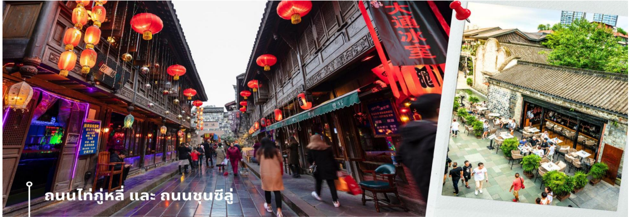
ถนนไท่กุ่หลี่ และ ถนนชุนชี่ลู่

18.20 น. เดินทางกลับกรุงเทพฯ โดยสายการบิน สายการบิน Chengdu Airlines เที่ยวบินที่ EU2867 20.30 น. เดินทางถึง สนามบินสุวรรณภูมิ โดยสวัสดิภาพ