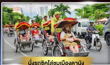
นั่งรถซิคไล่ชมเมืองดานัง