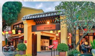
ชิมอาหารมิชลิน 1 มื้อ