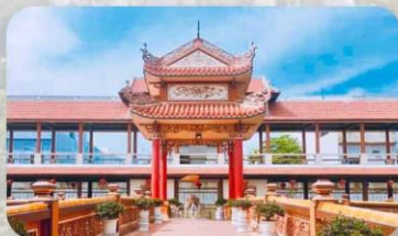
วัดนามเชิน