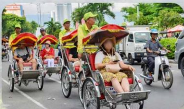
นั่งรถซิคโล่ชมเมืองดานัง

GOLD PLAZA HOTEL หรือเทียบเท่ามาตรฐานเวียดนาม