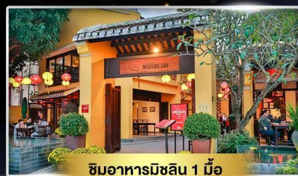
ชิมอาหารมิซึน 1 มื้อ