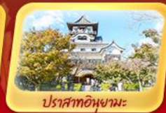
ปราสาทอินุยามะ