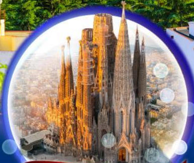
โบสถ์ซากราดาแฟมิลีย