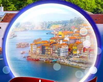
พอร์ตโต้