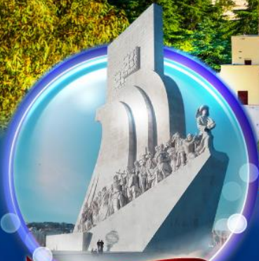
อนุสาวรีย์ดิสคัฟเวอรี