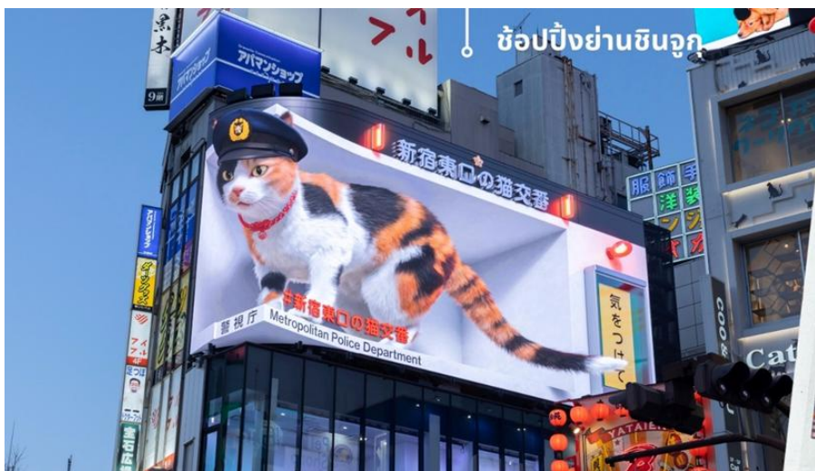
ช็อบปิ้งย่านชินจูกุ

จากนั้นนำท่านเดินทางสู่ย่าน ช็อบปิ้งชินจูกุ (Shinjuku) แหล่งช้อปปิ้งชื่อดังในโตเกียวให้ท่านอิสระและเพลิดเพลินกับการช้อปปิ้งสินค้ามากมายทั้งเครื่องใช้ไฟฟ้ากล้องถ่ายรูปดิจิตอลนาฬิกา เครื่องเล่นเกม หรือสินค้าที่จะเอาใจคุณผู้หญิงด้วยกระเป๋า รองเท้า เสื้อผ้าแบรนด์เนม เสื้อผ้าแฟชั่นสำหรับวัยรุ่น เครื่องสำอางยี่ห้อดังของญี่ปุ่นไม่ว่าจะเป็น KOSE, KANEBO, SK II, SHISEDO และอื่นๆอีกมากมาย