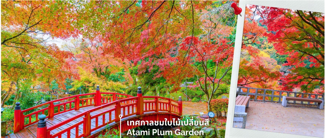
เทศกาลชมใบไม้เปลี่ยนสี Atami Plum Garden

** ระยะเวลาการเปลี่ยนสีของใบไม้และการบานของดอกไม้จะขึ้นอยู่กับสายพันธุ์และสภาพอากาศ **