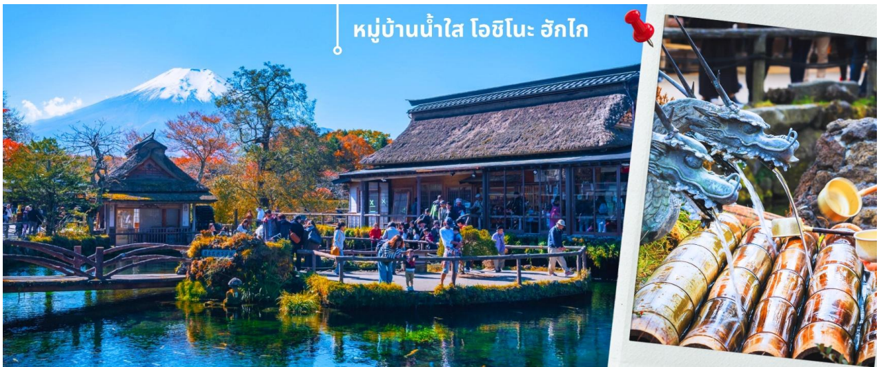
หมู่บ้านน้ำใส โอชิโนะ ฮักไก

หลังรับประทานอาหารเช้า นำท่านเดินทางสู่ หมู่บ้านน้ำใส โอชิโนะ ฮักไก (Oshino hakkai) ถือเป็นหมู่บ้านแห่งการท่องเที่ยวที่ยังคงความอุดมสมบูรณ์ของธรรมชาติเอาไว้ได้อย่างดีในหมู่บ้านมีบ่อน้ำใสที่เป็นน้ำที่ละลายมาจากหิมะบนภูเขาไฟฟูจิ ที่นี้มีความสวยงามในระดับที่ว่าได้รับการขึ้นทะเบียนให้เป็นมรดกทางธรรมชาติ ในปี ค.ศ. 1934 และได้รับคัดเลือกให้เป็นหนึ่งในภูมิทัศน์ทางน้ำที่งดงามในปีค.ศ. 1985 อีกด้วย ไฮไลท์ในช่วงฤดูใบไม้ร่วง หรือช่วงใบไม้เปลี่ยนสีก็อย่างหนึ่งก็คือ เราจะสามารถเห็นบรรยากาศหมู่บ้านที่ประกอบไปด้วยใบไม้สีแดง เหลือง ทิวบริเวณให้ความสวยงามไปอีกแบบและยังเป็นอีกหนึ่งสถานที่ที่เราสามารถมองเห็นวิวฟูจิ หากวันนั้นเป็นวันที่ฟ้าเปิด