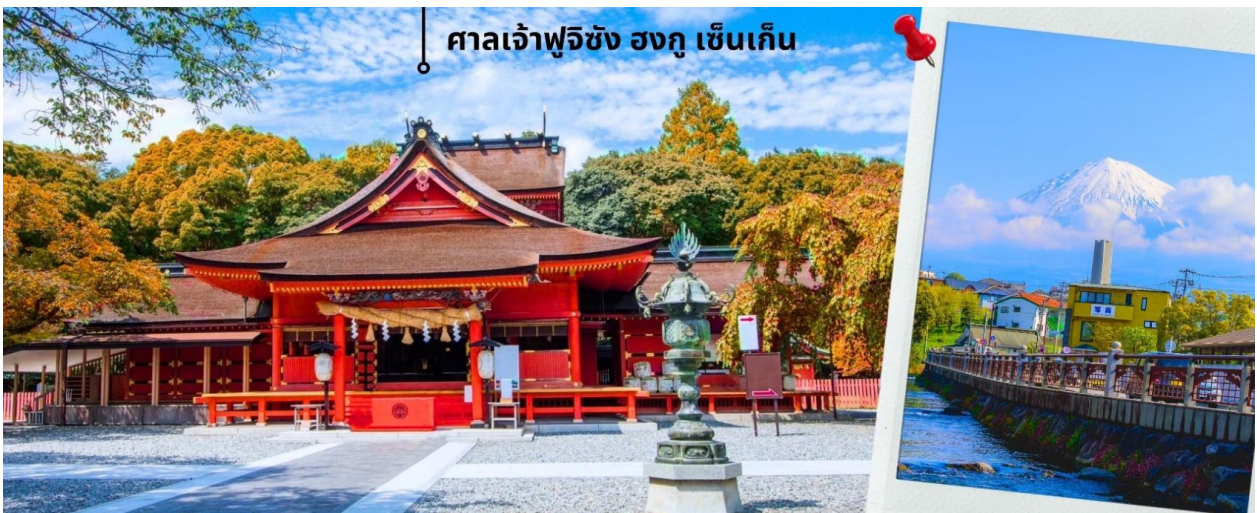
ศาลเจ้าฟูจิซัง ฮงกุ เซ็นเก็น

หลังรับประทานอาหารเที่ยง นำท่านเดินทางสู่ ศาลเจ้าฟูจิซัง ฮงกุ เซ็นเก็น ไทชะ (Fujisan Hongu Sengen Taisha) อยู่ทางทิศตะวันตกเฉียงใต้ของฐานภูเขาไฟฟูจิ เมืองฟูจิโนะมียะ (Fujinomiya) ศาลเจ้าอายุเก่าแก่กว่า 1,000 ปี สร้างขึ้นเพื่อเป็นการบวงสรวงเทพเจ้าของภูเขา เพื่อให้หยุดการปะทุของภูเขาไฟฟูจิในช่วงที่มีการระเบิด ถือเป็นศาลเจ้าที่สำคัญที่สุดของภูมิภาค นอกจากนี้ศาลเจ้าฟูจิซัง ฮงกุ เซ็นเก็น ไทชะ ยังเป็นส่วนหนึ่งของมรดกโลกทางวัฒนธรรมภูเขาฟูจิและยังเป็นแลนด์มาร์คสำหรับชมใบไม้เปลี่ยนสี พร้อมกับวิวภูเขาไฟฟูจิอีกด้วย