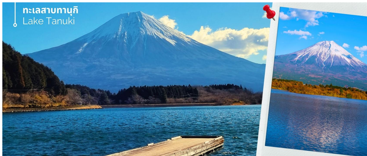
ทะเลสาบทานูกิ Lake Tanuki

หลังรับประทานอาหารเช้า นำท่านเดินทางสู่ ทะเลสาบทานูกิ (Lake Tanuki) สถานที่ท่องเที่ยวในฤดูใบไม้ร่วงที่ผสมผสานความงดงามของธรรมชาติและ ความเจียบสงบ ตั้งอยู่ที่ จังหวัดชิซุโอกะ เป็นสถานที่ที่ไม่ควรพลาดที่จะมาเยี่ยมชม โดยเฉพาะอย่างยิ่งในช่วงเดือนพฤศจิกายนเป็นต้นไป ต้นไม้โดยรอบทะเลสาบจะเปลี่ยนสีเป็นเฉดสีแดง ส้ม และเหลือง สร้างให้เกิดภาพวิวทิวทัศน์ที่งดงามราวกับภาพวาด โดยเฉพาะเมื่อสะท้อนกับผิวน้ำที่สงบนิ่ง พร้อมฉากหลังเป็นวิวภูเขาไฟฟูจิด้วยแล้วนั้น ยิ่งส่งให้บรรยากาศที่แห่งนี้เกิดความสวยงามยิ่งขึ้นไปอีก ให้ท่านได้อิสระเก็บภาพความประทับใจตามอัธยาศัย