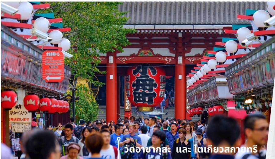
วัดอาซากุสะ และ โตเกียวสกายทรี

ร้านค้าขายของที่ระลึกพื้นเมืองต่างๆมากมายเช่นหน้ากาก ของเล่น รองเท้า พวงกุญแจ ของที่ระลึก และขนมหวานา ชนิดทั้งเมล่อนปังในตำนาน ดังโงะหนึบหนับและน่องปลาขนมไทยากิ ฯลฯ ให้ทุกท่านได้เลือกซื้อเป็นของฝากของที่ระลึก ให้จากนั้นนำท่านแวะถ่ายรูปกับ “TOKYO SKYTREE” (ด้านนอก) ที่บริเวณสะพานข้ามแม่น้ำสุมิตะหนึ่งในแลนด์มาร์คของโตเกียวเป็นหอคอยส่งสัญญาณโทรทัศน์ที่เป็นสิ่งปลูกสร้างที่สูงที่สุดในญี่ปุ่นและเป็นหอคอยที่สูงที่สุดในโลกตั้งอยู่ที่เขตสุมิตะหน้าที่หลักของโตเกียวสกายทรีคือการกระจายสัญญาณสื่อสารแบบดิจิตอลและโตเกียวสกายทรียังแทรกความเป็นมาของท้องถิ่นเอาไว้ด้วยความสูงของหอคอย 634 เมตร มาจาก มุซาชิคุนิชื่อเรียกในอดีตของแถบนี้ซึ่งตัวเลข 634 สามารถอ่านตามเสียงตัวเลขเป็นมุซาชิได้