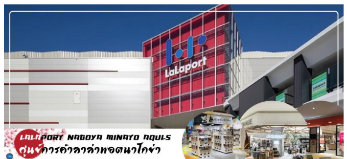
LALAPORT NAGOYA MINATO AQUUS ศูนย์การค้าคว่ำคว่ำพอดนาโกย่า

นำท่านสู่ ศูนย์การค้า LALAPORT NAGOYA MINATO AQUUS เป็นห้างสรรพสินค้าขนาดใหญ่ที่มีร้านค้ามากถึง 217 ร้าน ครอบคลุมพื้นที่กว่า 59,500 ตารางเมตร ไม่ว่าจะลูกค้าจะต้องการอะไรเช่นการช้อปปิ้งสินค้าแบรนด์ต่างๆ, สินค้าลดราคา, อาหารหรือของที่ระลึก นอกจากนี้ยังมีโซน Lala Plaza สำหรับเด็ก ที่คุณสามารถหาร้านขายของสำหรับเด็กๆ และยังมีสิ่งอำนวยความสะดวกเพื่อความบันเทิงมากมาย ที่นี้จึงเหมาะสำหรับทุกเพศทุกวัย