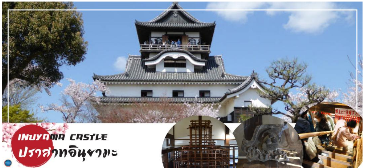
INUYAMA CASTLE ปราสาทอินุยามะ

นำท่าน เข้าชม ปราสาทอินุยามะ (Inuyama Castle) ตั้งอยู่ใจกลางเมืองอินุยามะ ทางตะวันตกเฉียงเหนือของจังหวัดไอจิ ประเทศญี่ปุ่น เป็นปราสาทที่สร้างขึ้นในตอนปลายศตวรรษที่ 16 ที่อยู่รอดมาจนถึงปัจจุบัน ปราสาทแห่งนี้มีความพิเศษตรงที่มีหอคอยที่มีความเก่าแก่ที่สุดในประเทศ ดังนั้นปราสาทแห่งนี้จึงได้รับการประกาศให้เป็นสมบัติของชาติ ด้านในของปราสาทมีการจัดแสดงอาวุธในการทำสงครามในสมัยต่าง ๆ ของญี่ปุ่น และเราสามารถเดินขึ้นไปด้านบนเพื่อชมความงามของตัวเมืองอินุยามะ ตลอดจนแม่น้ำคิโซะ และที่ราบโนบิได้