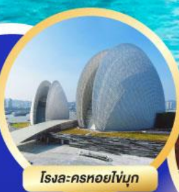
โรส-ครทอยโข่งกุ