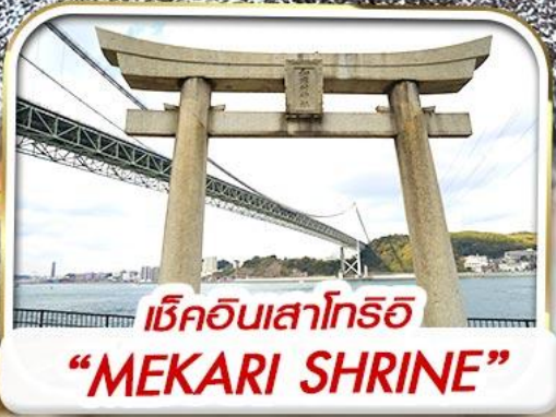
เช็คอินเสาโทริอิ "MEKARI SHRINE"

พีเรียตเดินทางปี 2568 15-19/22-26 สิงหาคม 68 29 ส.ค.-02 ก.ย. 68 03 - 07 กันยายน 68 05 - 09 กันยายน 68 26 - 30 กันยายน 68