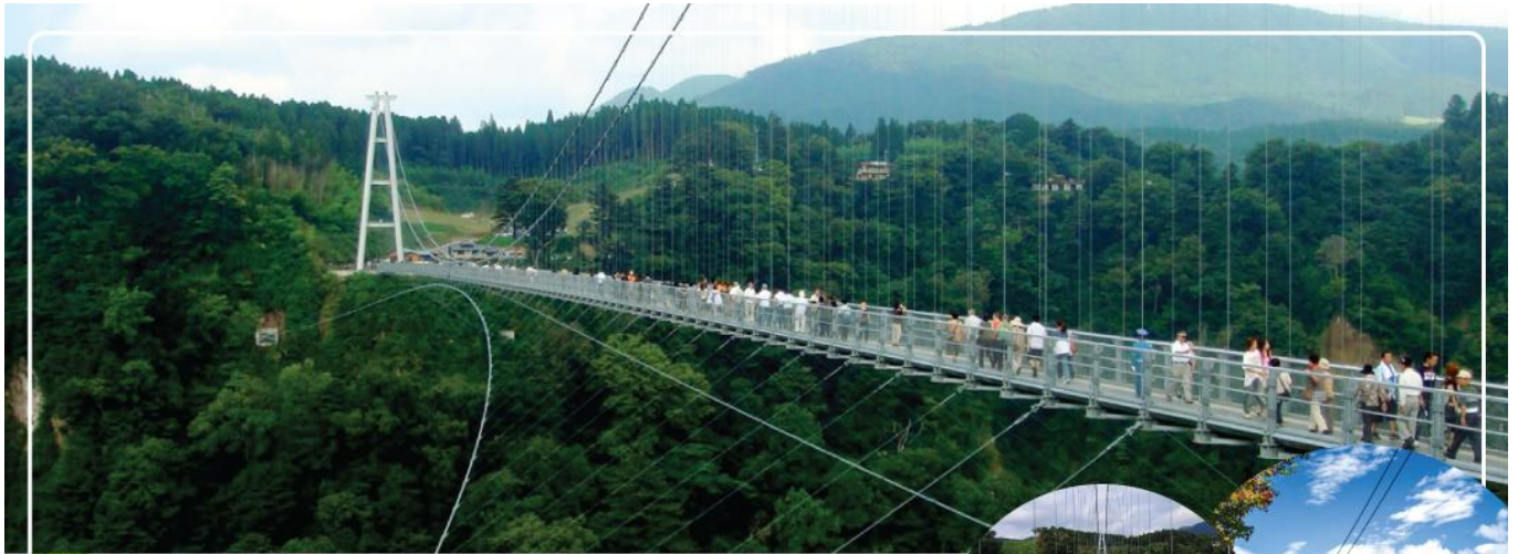
KOKONOE YUME SUSPENSION BRIDGE สะพานแขวนยูเมะ

วันที่สาม เมืองเบปปุ – สะพานแขวนโคโคโนเอะ ยูเมะ – เมืองคามาโมโตะ – ปราสาทคามาโมโตะ (เข้าชม) – ย่านช้อปปิ้งซากุระโนะบาระ โจไซเอน – คุมะมงสแควร์ – เมืองฟุคุโอกะ – ดิวตี้ฟรี – กันดั้ม ปาร์ค ฟุคุโอกะ