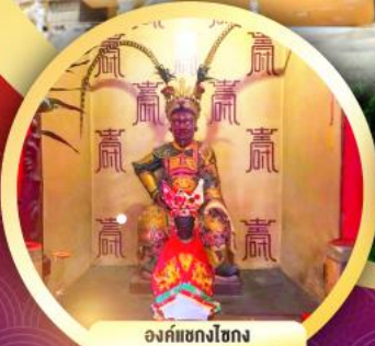
องค์เซกงโชก ขอพรโชกลาง การเงิน และธุรกิจ