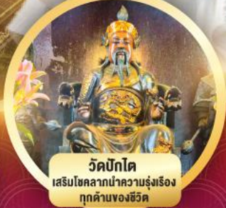
วัดบิกโต เสริมโชกลางนำความรุ่งเรือง ทุกด้านของชีวิต