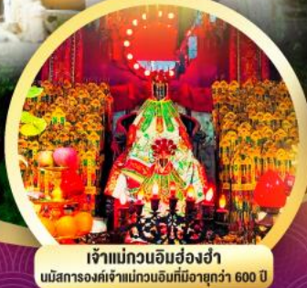
เจ้าแม่กวนอิมฮ่องฮ่า นมัสการองค์เจ้าแม่กวนอิมที่มีอายุกว่า 600 ปี