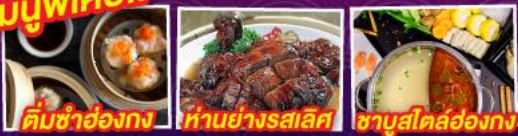
ติ่มซำฮ่องกง ห่านย่างรสเลิศ ซาซุสโตลล์ฮ่องกง