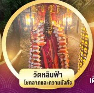
วัดหลินฟ้า โชกลางและความมั่งคั่ง