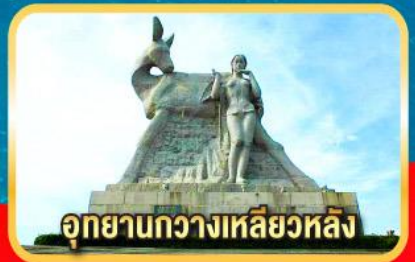
อุทยานกว้างเหลี่ยมหลิง

เมนูพิเศษ! ลิ้มรสไก่ไหหลำ, เซตซีฟู้ดกุ้งมังกร, ขันโตกข้าวเหนียวห้าสี, อาหารเจ ณ สวนพุทธธรรมหนานชาน