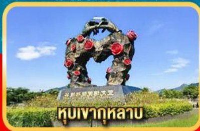
หุบเขากุหลาบ