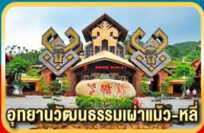
อุทยานวัฒนธรรมเข่าแม้ว-หลี่