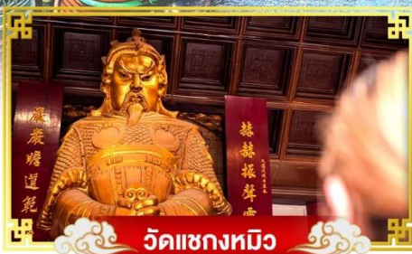
วัดแซกงทมิว