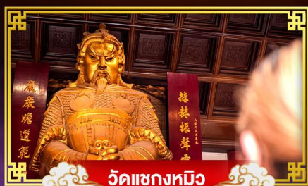
วัดเขกทมิฬ