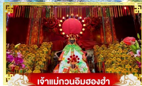
เจ้าแม่กวนอิมซงอ่า