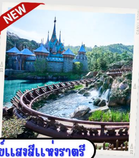
“MOMENTOUS” มหึศจรรยขแสงสีแห่งราตรี