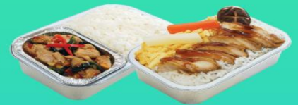
บริการอาหารร้อนบนเครื่อง ขาไป - ขากลับ