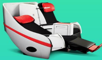
พรีเมียมฟลัดเบด