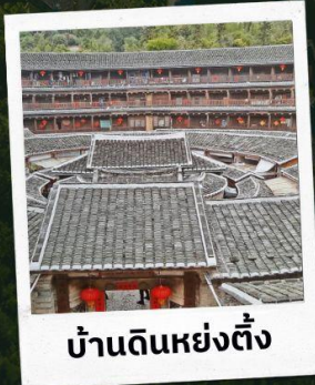
บ้านดินหย่งตั้ง