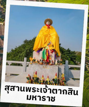
สุสานพระเจ้าตากสิน มหาราช