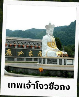
เทพเจ้าโจวซือกง