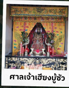
ศาลเจ้าเอียงบู๊ซัว