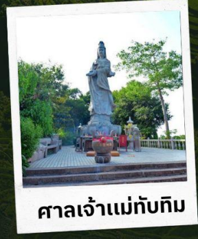
ศาลเจ้าแม่ทับทิม