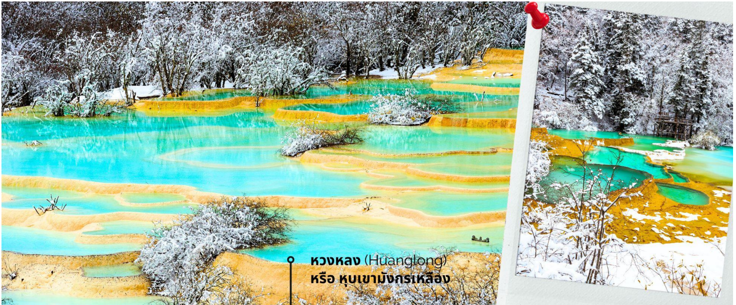
หวงหลง (Huanglong) หรือ หุบเขามังกรเหลือง

หวงหลง (Huanglong) หรือ หุบเขามังกรเหลือง (รวมค่ากระเช้าขึ้น-ลง หวงหลงและรถแบตเตอร์รี่) ที่ได้รับการขึ้นทะเบียนเป็นมรดกโลก รายล้อมไปด้วยแอ่งน้ำสีฟ้าจำนวนนับไม่ถ้วน และภูเขาสูงใหญ่สลับซับซ้อน อุทยานหวงหลง (Huanglong Scenic and Historic Interest Area) หรือ หุบเขามังกรเหลือง แหล่งธรรมชาติที่อุดมสมบูรณ์บนเทือกเขา Minshan Mountains มีระบบนิเวศที่หลากหลาย ทั้งน้ำพุร้อน น้ำตก แอ่งน้ำหินปูน รวมถึงเป็นแหล่งของพืชพรรณนานาชนิด และสัตว์ป่าใกล้สูญพันธุ์อย่าง แพนด้ายักษ์ และ ลิงจมูกเชิดสีทอง เป็นต้น ที่สำคัญยังมีทัศนียภาพที่สวยงามน่าทึ่งราวกับเป็นดินแดนสวรรค์ ด้วยคุณสมบัติเหล่านี้ อุทยานหวงหลงจึงได้รับการขึ้นทะเบียนเป็นมรดกโลกโดยองค์การ UNESCO เมื่อปี ค.ศ. 1992