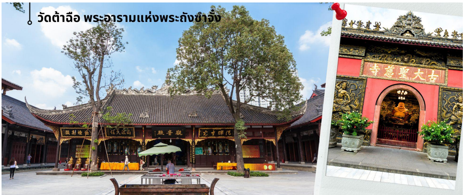
วัดต้าฉือ พระอารามแห่งพระถังซำจั๋ง

นำท่านชม วัดต้าฉือ พระอารามแห่งพระถังซำจั๋ง ใจกลางนครเฉิงตู พระถังซำจั๋ง ได้รับการสรรเสริญว่าเป็นผู้มีความเพียร และมีชื่อเสียงมายาวนานกว่า 1,400 ปี และยังได้รับการยกย่องว่าเป็น พระไตรปิฎกแห่งราชวงศ์ถัง พุทธประวัติของพระถังซำจั๋งถูกจารึกในสถานที่ต่าง ๆ มากมาย รวมไปถึงได้ถูกกล่าวถึงในจดหมายเหตุหลายเล่ม ตามเส้นทางการเดินทางแห่งความเพียรของท่าน รวมทั้งมีพระอัฐิของท่าน ประดิษฐานอยู่ในพระอารามของนครนานจิง และที่ทะเลสาบสุริยันจันทราเป็นเกาะได้วันอีกด้วย