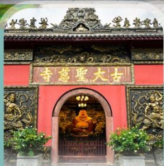
วัดโบราณต้าฉือ

✈️ คอนเฟิร์ม ออกเดินทาง ✈️ ทุกปีเรียกด 2 ท่านขึ้นไป