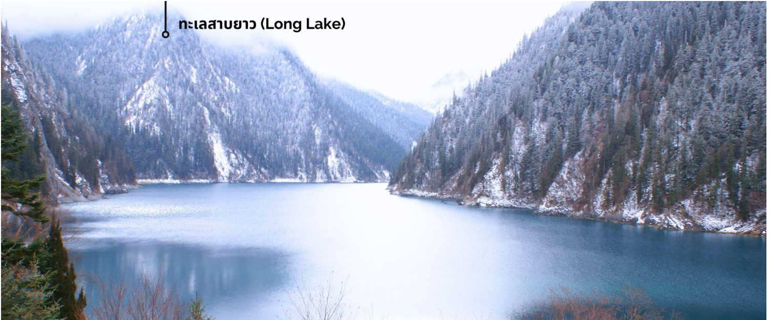
ทะเลสาบยาว (Long Lake)

ทะเลสาบที่ใหญ่ที่สุด สูงที่สุด และลึกที่สุดในจิวจ้ายโกว ด้วยเนื้อที่กว่า 581 ไร่ ความยาวกว่า 7 กิโลเมตร และลึกถึง 103 เมตร ทอดตัวโค้งเป็นรูปพระจันทร์เสี้ยว เนื่องจากหิมะบนภูเขาละลายลงมา น้ำในทะเลสาบสีฟ้าสวยงาม ล้อมรอบด้วยยอดเขาสูงชัน และต้นไม้เขียวใหญ่ที่ปกคลุมด้วยหิมะ งดงามราวหลุดออกมาจากภาพวาด ความพิเศษในช่วงฤดูหนาว ทะเลสาบจะกลายเป็นน้ำแข็งหนากว่า 60 เซนติเมตร ทำให้นักท่องเที่ยวนิยมมาเล่นสเก็ตน้ำแข็งกันเป็นจำนวนมาก