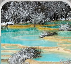
อุทยานแห่งชาติหวงหลง (บริการรถเช่าขึ้นลง+รถแคบเตอร์)