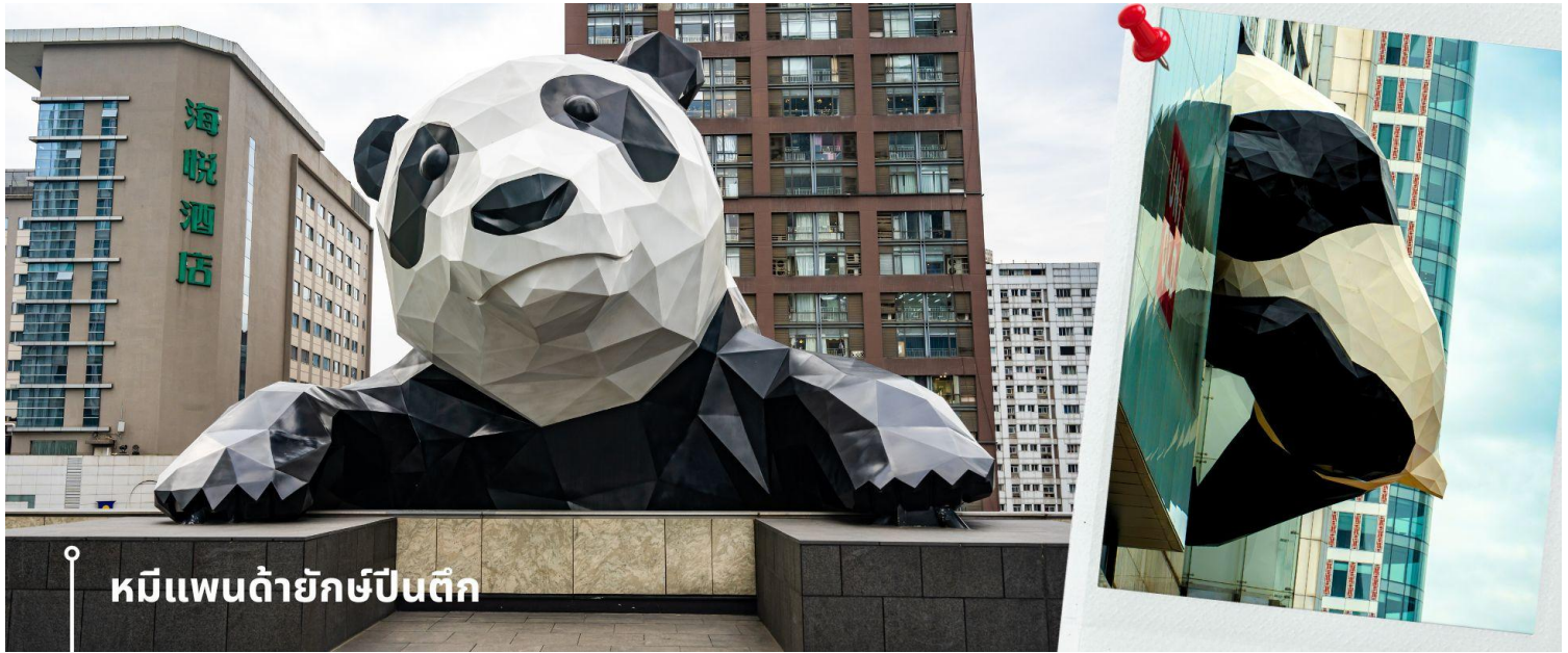
หมีแพนด้ายักษ์ป็นตึก

ป็นตึก และมีส่วนหัวที่โผล่พ้นออกมาจากอาคาร ทำให้เกิดภาพอันน่ารักและน่าประทับใจจากผู้ที่พบเห็นและนักท่องเที่ยว