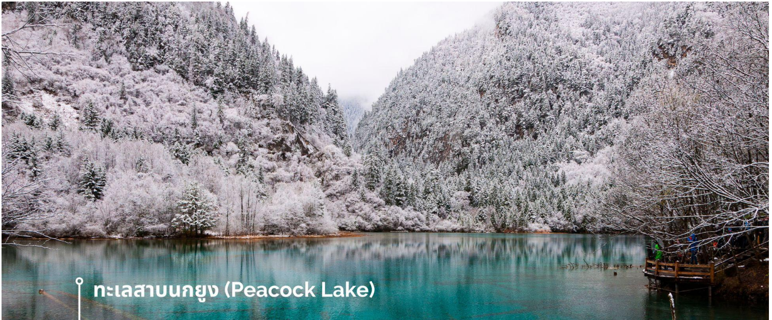
ทะเลสาบนกยูง (Peacock Lake)

ทะเลสาบมีรูปร่างคล้ายกับนกยูง จึงเป็นที่มาของชื่อ แม้พื้นที่จะไม่กว้างมากนัก มีความยาวเพียงแค่ 310 เมตร แต่ความสวยงามของที่นี่ก็ไม่แพ้จุดอื่นๆ ของอุทยานฯ เพราะน้ำในทะเลสาบเป็นสีฟ้าใสราวกับคริสตัล ไล่เฉดฟ้าอ่อน ฟ้าอมเขียว และน้ำเงินตามความตื้นลึกของน้ำ ในช่วงฤดูหนาวต้นไม้จะถูกปกคลุมไปด้วยหิมะสีขาวนวล ดูแล้วคล้ายนกยูงกำลังจำศีล หากมาในช่วงที่มีแสงแดดจะมองเห็นความงดงามได้ทั่วบริเวณ