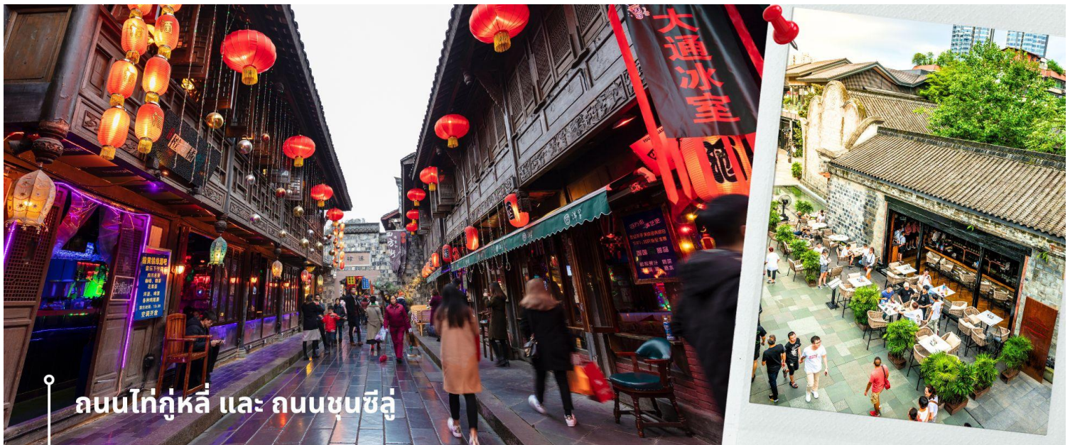
ถนนไท่กู่หลี่ และ ถนนซุนซีลู่

จากนั้นให้ท่านให้อิสระกับการเลือกซื้อสินค้าของฝากที่ ถนนไท่กู่หลี่ และ ถนนซุนซีลู่ ในย่านนี้เป็นถนนโบราณ ในอดีตเคยโรงงานผลิตผ้าไหมใหญ่ที่สุดในจีน ปัจจุบันได้เปลี่ยนเป็นถนนช้อปปิ้งแหล่งสวรรค์ของนักท่องเที่ยว เป็นถนนคนเดิน มีห้างสรรพสินค้าชื่อดัง มีร้านค้ามากกว่า 700 ร้านค้าที่เต็มไปด้วยสินค้าต่าง ๆ ทั้งร้านค้าแฟชั่น ร้านอาหารและโรงแรมนานาชาติมากมายซึ่งเป็นที่ที่เที่ยวเชิงตุ๋ตงที่มีการเชื่อมต่อทางวัฒนธรรมท้องถิ่นที่เป็นแหล่งช้อปปิ้งและเป็นแหล่งร้านอาหารที่อร่อยต่าง ๆ มากมาย ซึ่งเป็นสถานที่ที่เที่ยวของเชิงตุ๋ตงที่ทำให้เพลิดเพลินกับสินค้าแบรนด์เนมและแบรนด์จีน