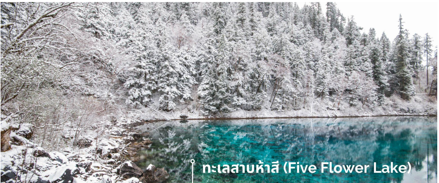
ทะเลสาบห้าสี (Five Flower Lake)

หนึ่งในจุดที่สวยงามและนักท่องเที่ยวแวะมาเยี่ยมชมเยอะที่สุด ตั้งอยู่ที่ความสูงเหนือระดับน้ำทะเลประมาณ 2,472 เมตร น้ำลึกประมาณ 5 เมตร น้ำใสจนเห็นพื้นด้านล่างของทะเลสาบ สีของผิวน้ำสวยงามแปลกตา โดยเฉพาะเมื่อยามแสงอาทิตย์สาดส่องกระทบผิวน้ำ สีของน้ำในทะเลสาบจะสะท้อนเป็นสีส้มถึง 5 เฉดสี สวยงามสะกดตา ซึ่งสาเหตุที่ทำให้เกิดสีส้มต่างๆ นี้มาจากการสะสมของแร่ธาตุ และพืชน้ำชนิดต่างๆ โดยจะมีสีส้มแตกต่างกันไปตามฤดูกาลและช่วงเวลา ยิ่งถ้ามาในช่วงฤดูหนาว ต้นไม้ริมทะเลสาบจะเต็มไปด้วยหิมะสีขาวตัดกับสีของทะเลสาบ ดูสวยงามแปลกตา