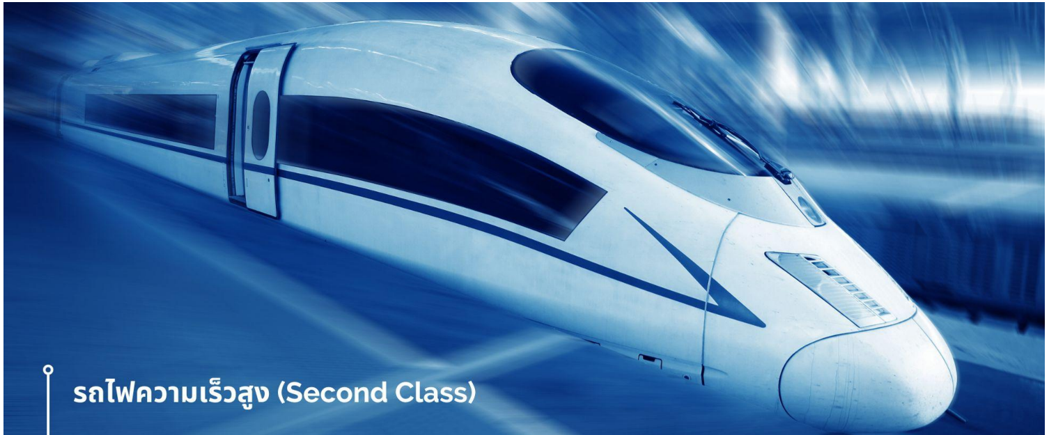
รถไฟความเร็วสูง (Second Class)

นำท่านเดินทางสู่สถานีรถไฟ เพื่อเดินทางด้วย รถไฟความเร็วสูง (Second Class)