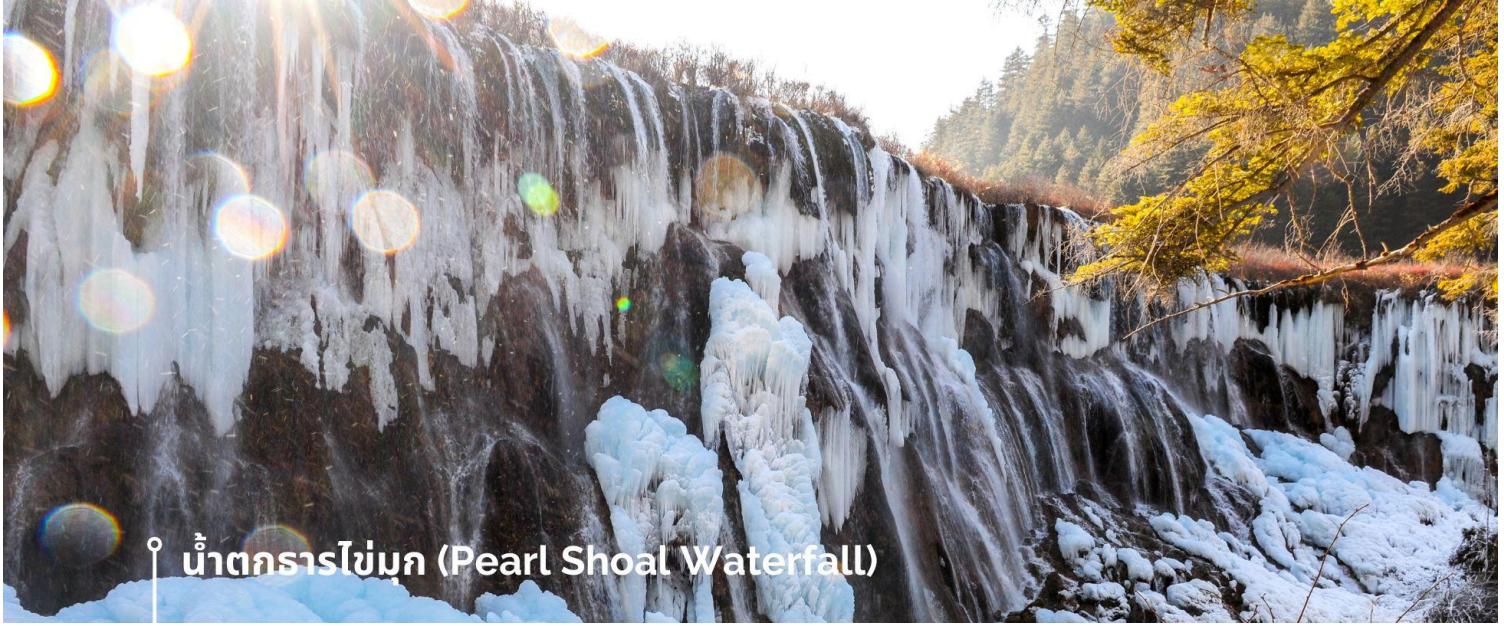
น้ำตกรรโช่มุก (Pearl Shoal Waterfall)

จากแสงแดดที่สะท้อนกับละอองน้ำอีกด้วย หากได้มาในช่วงฤดูหนาว ก็จะได้เห็นหิมะเกาะตามต้นไม้ โขดหิน และถ้าอากาศหนาวมากๆ น้ำที่น้ำตกก็จะกลายเป็นน้ำแข็ง กลายเป็นประติมากรรมจากธรรมชาติที่สวยงาม