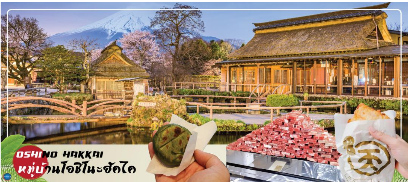
OSHINO HAKKAI หมู่บ้านโอชิโนะฮัคไค

ได้เวลาอันสมควรนำท่านเดินทางสู่ หมู่บ้านโอชิโนะฮัคไค (Oshino Hakkai) ให้ท่านเจาะลึกตามหาแหล่งน้ำบริสุทธิ์จากภูเขาไฟฟูจิ ที่เป็นแหล่งน้ำตามธรรมชาติตั้งอยู่ในหมู่บ้านโอชิโนะ จ.ยามานชิ หรือพูดในทางกลับกันคือกลุ่มน้ำผุดโอชิโนะฮัคไค เพียงก้าวแรกที่ย่างเท้าเข้าไปในหมู่บ้านก็สัมผัสได้ถึงอากาศบริสุทธิ์ และไอเย็นจากแหล่งน้ำธรรมชาติที่มีให้เห็นอยู่ทุกมุม โดยในบ่อน้ำใสแจ๋วมีปลาหลากหลายพันธุ์แหวกว่ายอย่างสบายอารมณ์ แต่ขอบอกเลยว่าน้ำแต่ละบ่อนั้นเย็นจับใจจนแอบสงสัยว่าน้องปลาไม่หนาวสะท้านกันบ้างหรือ เพราะอุณหภูมิในน้ำเฉลี่ยอยู่ที่ 10-12 องศาเซลเซียสนอกจากชมแล้วก็ยังมีน้ำผุดจากธรรมชาติให้ดื่กดื่มตามอัธยาศัย และที่สำคัญ หมู่บ้านโอชิโนะยังเป็นแหล่งช้อปปิ้งสินค้าโอท็อปชั้นเยี่ยมอีกด้วย