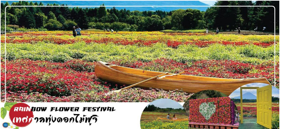
RAINBOW FLOWER FESTIVAL เทศกาลทุ่งดอกไม้ฟูจิ

ทะเลสาบคาวากูจิในช่วงต้นฤดูร้อน ซึ่งนอกจากจะจัดขึ้นเพื่อต้อนรับฤดูชมดอกลาเวนเดอร์แล้ว ยังจะได้เพลิดเพลินไปกับความงามของดอกไม้หลากชนิด เช่น ดอกคาโมมายล์และสนุนไพรมากมาย โดยสถานที่จัดงานหลักคือ สวนสาธารณะยากิซาคิ (Yagizaki Park) สวนยอดนิยมที่ดึงดูดนักท่องเที่ยวมากมายด้วยลาเวนเดอร์ชอฟคริมและชาสนุนไพร์ และสวนสาธารณะโออิชิ (Oishi Park) ที่มีภาพภูเขาฟูจิซึ่งเป็นฉากหลังของทะเลสาบคาวากูจิติดกันกับภาพทุ่งดอกลาเวนเดอร์อย่างสวยงาม อิสระให้ท่านได้วิ่งเล่นท่ามกลางทุ่งดอกลาเวนเดอร์สีม่วงสดใส สัมผัสกลิ่นหอมสดชื่น และเพลิดเพลินกับทิวทัศน์อันงดงาม พร้อมเก็บภาพความประทับใจตามอัธยาศัย (ดอกลาเวนเดอร์ จะบานหรือไม่มัน ขึ้นอยู่กับสภาพอากาศ สงวนสิทธิ์หากช่วงวันเดินทางลาเวนเดอร์ไม่มีแล้ว ใจัดสามารถปรับโปรแกรมได้โดยไม่ต้องแจ้งล่วงหน้า) หรือ ชม Rainbow Flower Festival 2025 (ปกติเทศกาลจะจัดช่วง ปลายเดือนสิงหาคม - ต้นเดือนตุลาคม ซึ่งกำหนดการปีนี้ยังไม่มีการประกาศอย่างเป็นทางการ) สถานที่จัดงานบริเวณคาวากูจิโกะ เมืองแห่งภูเขาไฟฟูจิ เทศกาลดอกไม้เมืองร้อนที่มีชื่อเสียงของญี่ปุ่น ที่มีเพียงปีละครั้งเท่านั้น ภายในเทศกาลมีการจัดแสดงดอกไม้เมืองร้อนหลากหลายกว่า 10 ชนิด ไม่ว่าจะเป็น ดอกบิโกเนีย, ดอกซินเนีย, ดอกซัลเวีย และดอกรัตเบเกีย นอกจากนี้ยังสามารถมองเห็นวิวของภูเขาไฟฟูจิได้อีกด้วย ภายในสวนมีจุดให้ถ่ายรูปมากมาย และยังมีสวนดอกไม้สไตล์อังกฤษที่มาพร้อมตัวละครมาสคอตสุดน่ารัก "Piter Rabbit English Gardent" และนอกจากนี้ยังมีคาเฟ่ไว้นั่งพักผ่อนชมวิวแบบชิๆอีกด้วย