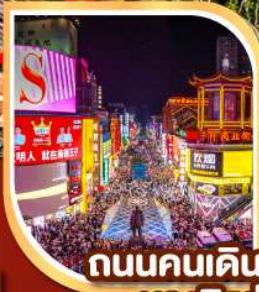
ถนนคนเดิน หวงซิงลู่