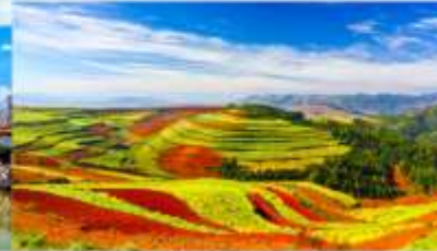
แผ่นดินสีแดง

*ทางบริษัทฯ ขอสงวนสิทธิ์ในการสลับโปรแกรมทัวร์ตามความเหมาะสมขึ้นอยู่กับสถานการณ์หน้างาน โดยคำนึงถึงผลประโยชน์ของลูกค้าเป็นสำคัญ