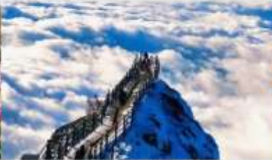
ภูเขาหิมะเจียวจื่อ