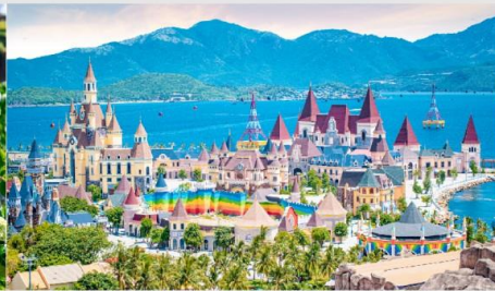
VinWonders NHA TRANG