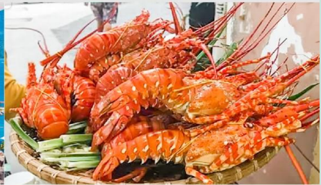
Nha Trang Night Market

*ทางบริษัทฯ ขอสงวนสิทธิ์ในการสลับโปรแกรมทัวร์ตามความเหมาะสมขึ้นอยู่กับสถานการณ์หน้างาน โดยคำนึงถึงผลประโยชน์ของลูกค้าเป็นสำคัญ