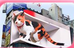
ช้อปปิ้งย่านชินจูกุ