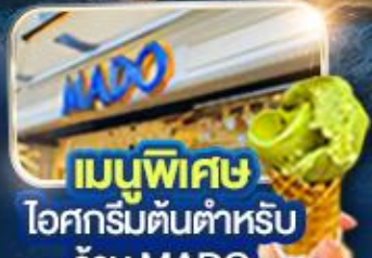
เมนูพิเศษ ไอศกรีมต้นตำหรับ ร้าน MADO

พิเศษ! ล่องเรือชมความสวยงามช่องแคบ 2 ทวีป "ช่องแคบบอสฟอรัส"