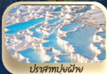
ปราสาทปูยฝ้าย