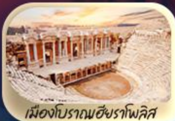
เมืองโบราณฮิเอร์ราโพลิส