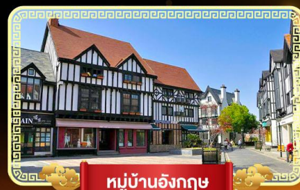
หมู่บ้านอังกฤษ