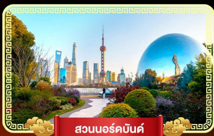
สวนนอร์คบินด์