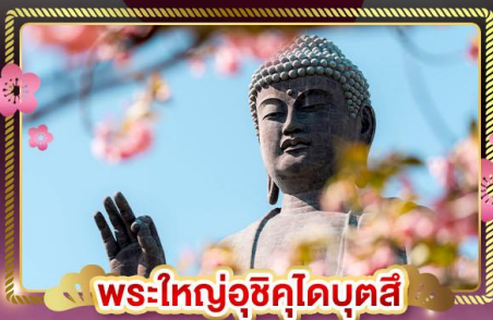
พระใหญ่อุซึคุโดบุตสึ