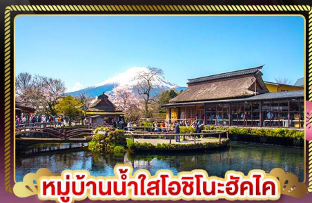
หมู่บ้านน้ำใสโอชิโนะฮิโค