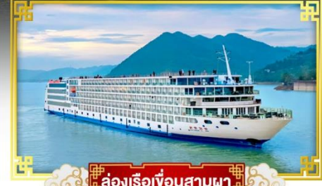
ล่องเรือเขื่อนสามผา