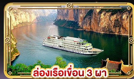
ล่องเรือเขื่อน 3 ผา