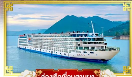
ล่องเรือเขื่อนสามผา