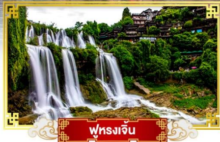
ฟูหลงเจิ้น