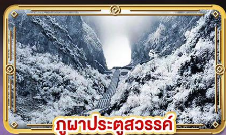
กู่ผาประตูสวรรค์