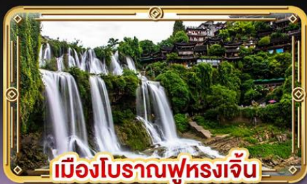
เมืองโบราณฟุหลงเจิ่น