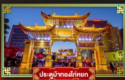
ประตูน้ำทองโก๋หยก