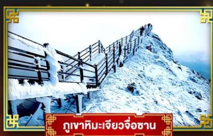
ภูเขาหิมะเจียวจื่อซาน