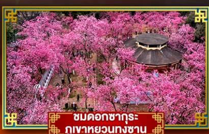
ชมดอกซากุระ ภูเขาหยวนกงซาน