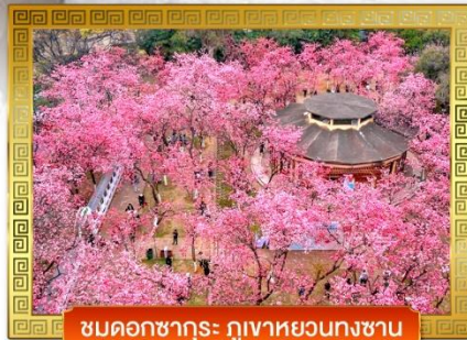
ชมดอกซากุระ ภูเขาหยวนกงซาน