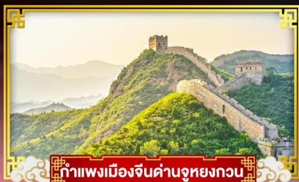
กำแพงเมืองจีนด่านจูหยงกวน