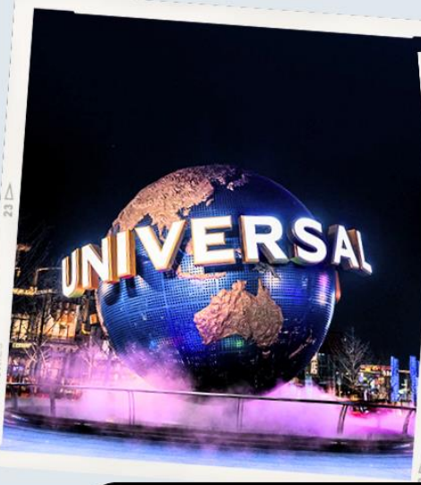
UNIVERSAL CITYWALK BEIJING