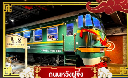
ถนนหัวงฝูเจิ้ง