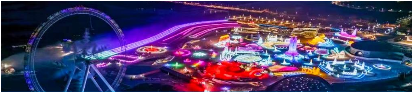
เทศกาลแกะสลักน้ำแข็งนานาชาติ

หลังอาหารนำท่านเที่ยวชมงาน เทศกาลแกะสลักน้ำแข็งนานาชาติ 冰雪大世界 Harbin 2025 International Ice and Snow Festival *รวมบัตรเข้าชมงานแล้ว* งานนิทรรศการและศิลปกรรมแกะสลักนานาชาติประจำปีที่ยิ่งใหญ่และอลังการ ด้วยสภาพอากาศที่หนาวเย็นในช่วงฤดูหนาวของเมืองฮาร์บิ้น ที่นี้ได้กลายเป็นลานประกวดประติมากรรมน้ำแข็งกลางแจ้งที่ใหญ่และมีชื่อเสียงที่สุดของโลก ให้ท่านได้เดินเที่ยวชมความสวยงาม ตระการตาของประติมากรรมน้ำแข็งที่ประดับด้วยแสงสีตามอัธยาศัย.....จนสมควรแก่เวลา นำท่านเดินทางกลับโรงแรม