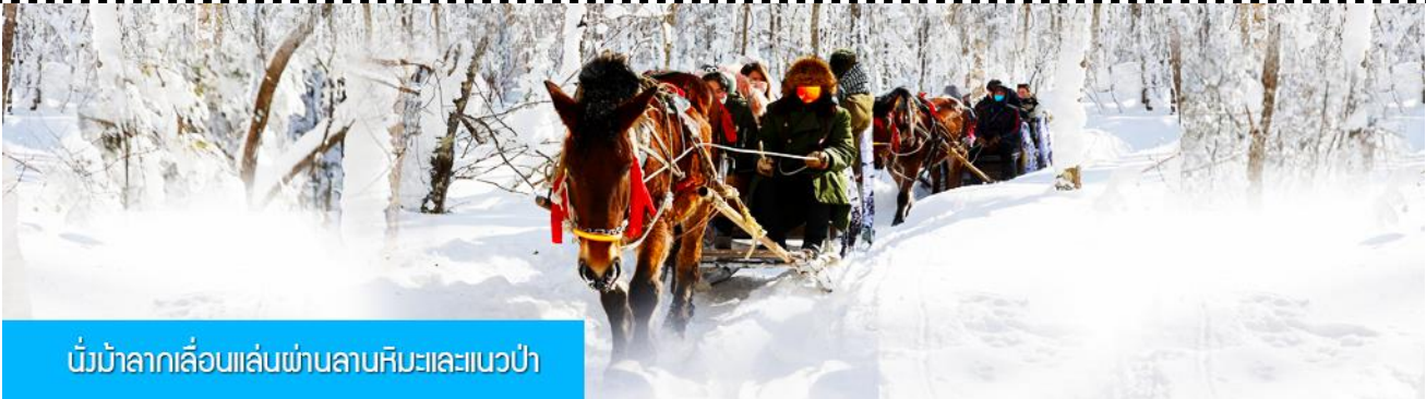
นั่งม้าลากเลื่อนผ่านลานหิมะและแนวป่า

220 หยวน หรือ 1100 บาท อัตรานี้รวมค่าบัตรผ่านเข้าอุทยาน ค่ารถรับ ส่ง และค่าบริการของไกด์ท้องถิ่น และค่าบริหารจัดการของบริษัททัวร์ท้องถิ่น หมายเหตุ โปรแกรมเสริมเป็นโปรแกรมที่ท่านต้องเสียค่าใช้จ่ายเองด้วยความสมัครใจ สำหรับท่านที่ไม่เข้าร่วมกิจกรรมดังกล่าวสามารถนั่งพักในรถได้