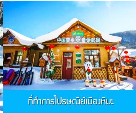
ที่ทำการไปรษณีย์เมืองหิมะ

วันที่สี่ พิพิธภัณฑ์เมืองหิมะ – ที่ทำการไปรษณีย์เมืองหิมะ – ไกด์ขายออฟชั่นภาพเขียนสิบลี้-และออฟชั่นม้าลากเลื่อน-เมืองฮาร์บิน