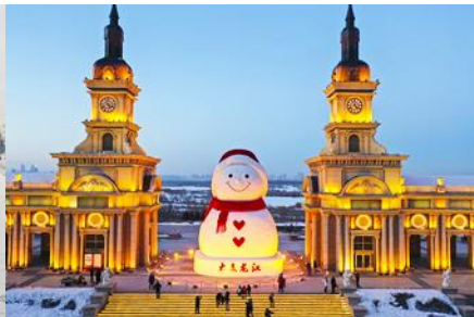
ตุ๊กตาหิมะยักษ์