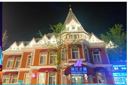
ถนนรัสเซีย