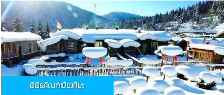
พิพิธภัณฑ์เมืองหิมะ

หมายเหตุ การไปพักในเมืองหิมะทางทัวร์ไม่สามารถจัดรถทัวร์ไปส่งลูกค้าถึงหน้าโฮมสเตย์ได้ ทางคณะต้องนั่งรถเมล์หมู่บ้านเข้าไป โดยลูกค้าต้องถือหรือลากกระเป๋าเข้าที่พักด้วยตัวเอง เพราะโฮมสเตย์จะไม่มีพนักงานยกกระเป๋า มาคอยบริการยกกระเป๋าให้ผู้เข้าพัก ท่านควรจัดเตรียมกระเป๋าใบเล็กที่บรรจุเสื้อผ้า และเครื่องใช้จำเป็นสำหรับการพักผ่อน ณ โฮมสเตย์ในเมืองหิมะในคืนนี้ เพื่อสะดวกต่อการเคลื่อนย้ายกระเป๋า, และภายใน จะมีมีสบู แชมพู บริการ แปรงสีฟันยาสีฟัน, จะไม่มีหมวกคลุมผมควรติดไปด้วย