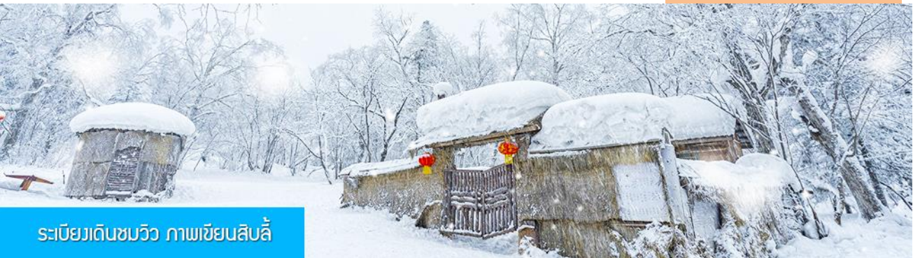
ระเบียบงเดินชมวิว ภาพเขียนสิบลี้

เที่ยง รับประทานอาหารกลางวัน ณ ภัตตาคาร หลังอาหารนำท่านเดินทางกลับเมืองฮาร์บิน (ใช้เวลาเดินทางโดยรถบัสราว 5 ชั่วโมง) ระหว่างทางไกด์ท้องถิ่นจะเสนอขายโปรแกรมเสริมที่ไม่ได้รวมในค่าทัวร์ (ออฟชั่นแนล ทัวร์) 2 รายการ