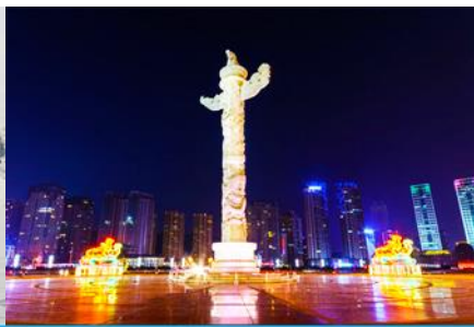
จัตุรัสชิงไห่