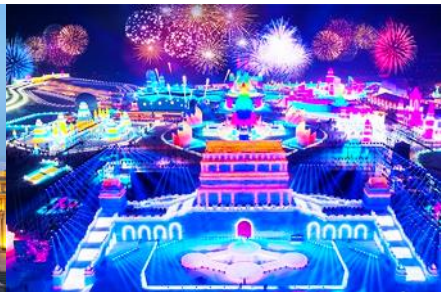
เทศกาลแกะสลักน้ำแข็งนานาชาติ

วันที่สอง เมืองต้าเหลียน-รถไฟความเร็วสูงสู่เมืองฮาร์บิน (รวมเจ้าหน้าที่ขนกระเป๋าขึ้นรถไฟ)-เมืองฮาร์บิน-ศูนย์จำหน่ายอุปกรณ์กันหนาว-ตุ๊กตาหิมะยักษ์ - เข้าร่วมงานเทศกาลแกะสลักน้ำแข็งนานาชาติ (รวมบัตรเข้าชมแล้ว)