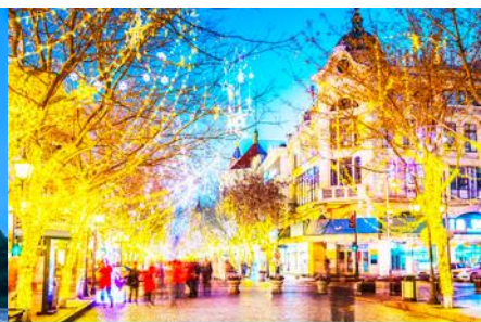
ถนนจยงลู่

วันที่ห้า เมืองฮาร์บิน – โบสถ์โซเฟีย - อนุสาวรีย์ป้องกันอุทกภัย – ถนนจยงลู่ – นั่งรถไฟความเร็วสูงกลับเมืองต้าเหลียน (รวมเจ้าหน้าที่ขึ้นกระเป๋้าขึ้นรถไฟ) – จัตุรัสชิงไห่ – ถนนรัสเซีย