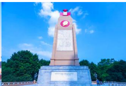
อนุสาวรีย์พิงหว