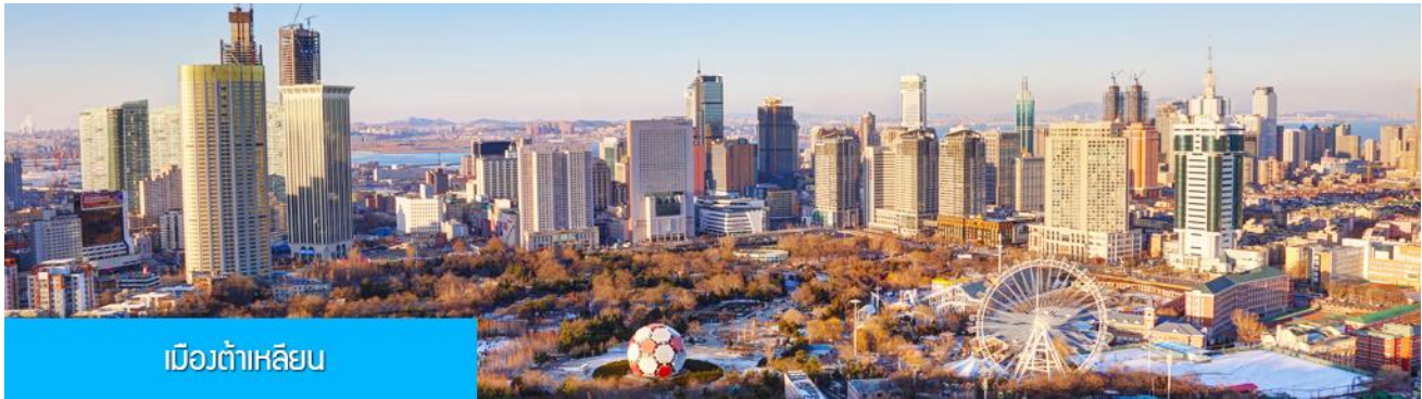
เมืองต้าเหลียน