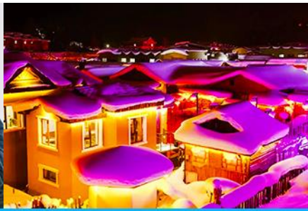
เมืองหิมะ: Xue xiang