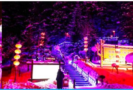
ระเบียงชมวิว บึงดูยซาน