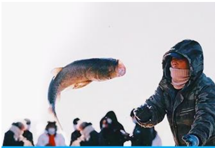
การจับปลาในฤดูหนาว