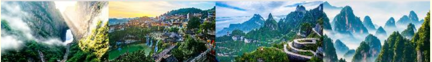
ประตูลั่วสวรงค์