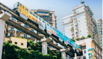
รถไฟฟ้าทะเลสาบ