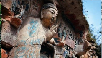
ผาหินแกะสลักต้าจู้ เขาเป่าติงซาน