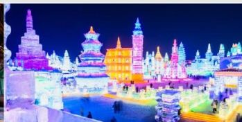
เทศกาลโคมไฟน้ำแข็ง