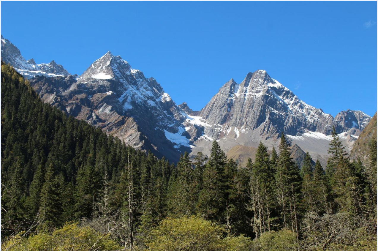
ฤดูใบไม้ผลิ (SPRING)