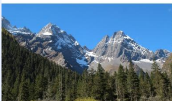
ภูเขาสี่ดรุณี (หุบเขาช่องเจียวโกว)