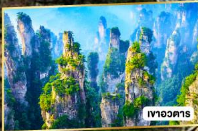
เขาวงคาร