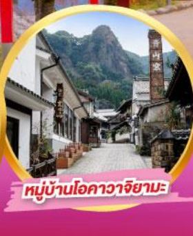
หมู่บ้านโอคาวาจิยามะ