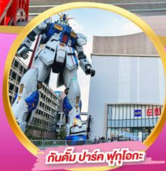
กันดั้ม ปาร์ค ฟุกุโอกะ

สัมผัสความโรแมนติก ชมซากุระในคิวชู พักออนเซ็น 1 คืนพร้อมอาหารค่ำ อิสระท่องเที่ยว 1 วันเต็มในฟุกุโอกะ