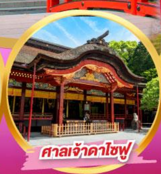
ศาลเจ้าคาโซฟู