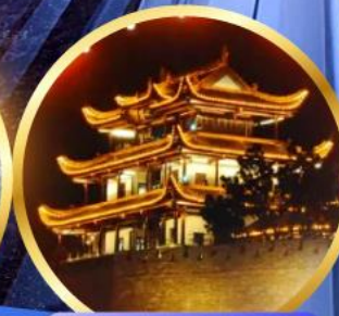
หอคอยทองคำเทียนซิน