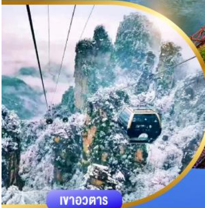
เขาวงตาร