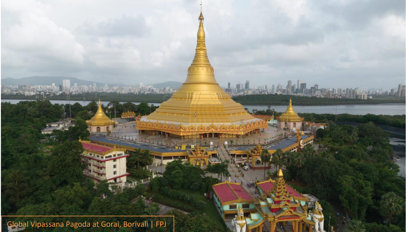
Global Vipassana Pagoda at Gorai, Borivali