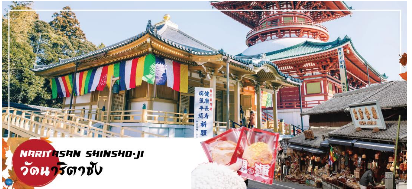
NARITASAN SHINSHO-JI วัดนาริตะชิน