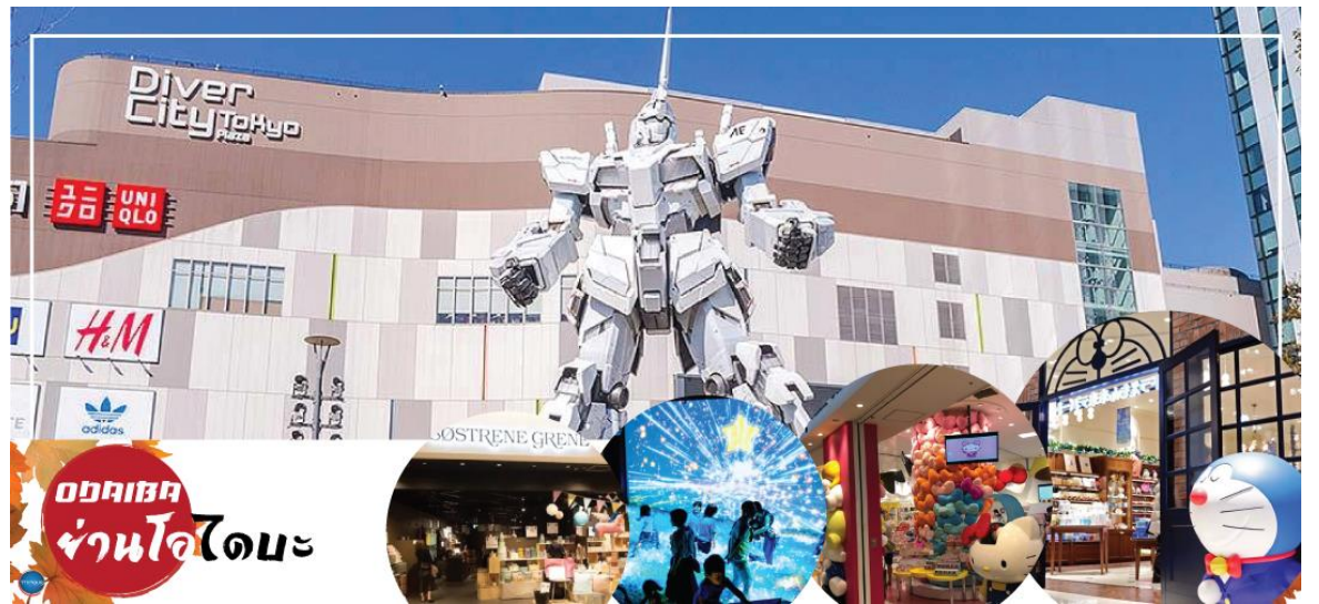
ออดิบะ ย่านโอไดบะ

อิสระรับประทานอาหารเช้ากลางวันตามอัธยาศัย นำท่านเดินทางสู่ ย่านโอไดบะ (Odaiba) (ใช้เวลาเดินทางโดยประมาณ 1.20 ชั่วโมง) เมืองคือเกาะที่สร้างขึ้นไว้เป็นแหล่งช้อปปิ้ง และแหล่งบันเทิงต่างๆ ในอ่าวโตเกียว ได้รับการปรับปรุงให้มีชื่อเสียงและเป็นที่ยอมรับในช่วงหลังของปี 1990 นอกจากมีสถาปัตยกรรมที่สวยงามตั้งอยู่มากมายแล้ว แต่ก็ยังคงความเป็นธรรมชาติไว้ด้วยความอุดมสมบูรณ์ของพื้นที่สีเขียว ไดเวอร์ซิตี โตเกียว พลาซ่า (Diver City Tokyo Plaza) เป็นห้างดังอีกห้างหนึ่ง ที่อยู่บนเกาะ โอไดบะ จุดเด่นของห้างนี้ก็คือหุ่นยนต์กันดั้ม ขนาดเท่าของจริง ซึ่งมีขนาดใหญ่มาก ในบริเวณห้าง อิสระช้อปปิ้งตามอัธยาศัย