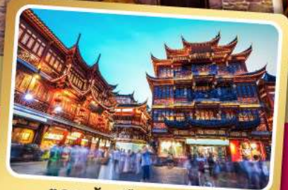
ตลาดร้อยปีเฉิงหวังเมี่ยว