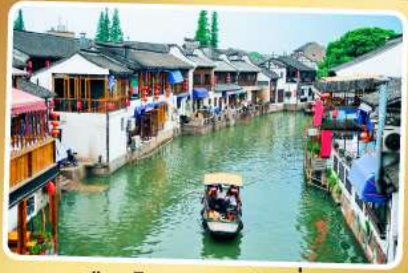
เมืองโบราณจูเจียเจี๋ย