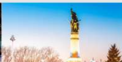
อนุสาวรีย์ผึ้งหง