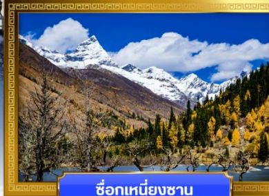
ชื่อภูเขาหิมะชาน