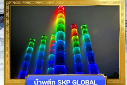
น้ำพุตึก SKP GLOBAL