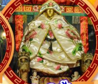
วัดเขลีนฟ้า