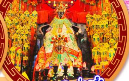
เจ้าแม่กวนอิมฮ่องฮำ

นมัสการเจ้าแม่กวนอิมฮ่องฮำ หมุนกังหันรับโชคลาภเงินทองที่วัดแชกงหมิว ขอพรความรักกับผู้เต่าจีนตรา วัดหวังต้าเซียน