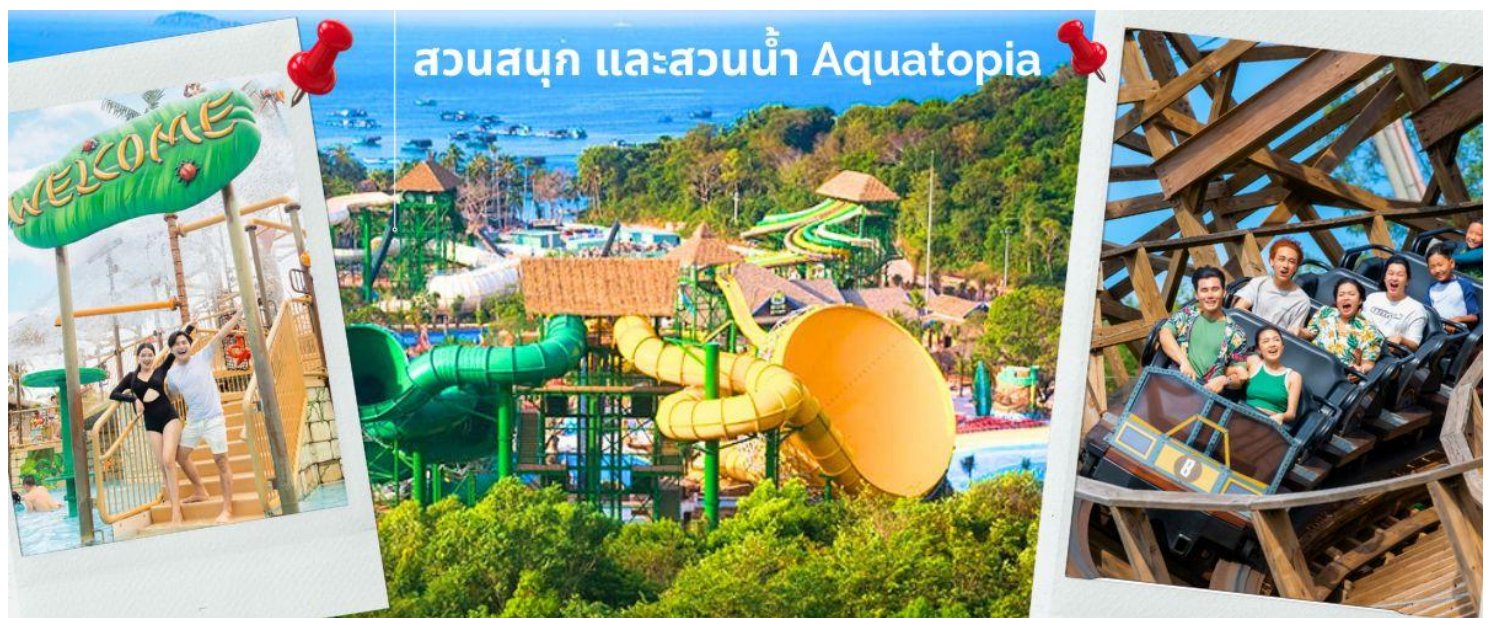
สวนสนุก และสวนน้ำ Aquatopia

จากนั้นนำท่าน ชมสวนน้ำ และสวนสนุก Aquatopia Park ที่ตั้งอยู่บนเกาะฮอนเทิม (Hon Thom) ประกอบไปด้วยสวนน้ำขนาดใหญ่ และเครื่องเล่นมากมายให้ท่านได้เลือกเล่นได้ตามใจชอบ สวนน้ำ Aquatopia ตั้งอยู่ทางตอนใต้ของเกาะฟูโก๊วก ถือเป็นสวนน้ำที่ใหญ่ที่สุดในเอเชียตะวันออกเฉียงใต้ที่มีเครื่องเล่นที่ทันสมัยมากกว่า 20 ชนิด นอกจากโซนสวนน้ำที่เหมาะสมสำหรับครอบครัวแล้ว Aquatopia Park ยังมีเครื่องเล่นที่น่าตื่นเต้นอีกมากมายให้ท่านได้เลือกเพลิดเพลิน รวมไปถึงร้านค้าจำหน่ายของฝาก และร้านอาหารมากมายให้เลือกรับประทาน ระหว่างเดินเที่ยวในสวนสนุกแห่งนี้