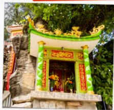
ศาลเจ้าดิงขาว