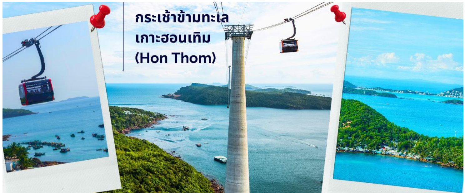
กระเช้าข้ามทะเล เกาะฮอนเทิม (Hon Thom)

นำท่านนั่ง กระเช้าข้ามทะเล Hon Thom Cable Car บรรยากาศสุดตื่นเต้นประทับใจ กับความสูงของกระเช้าและยังทอดยาว ข้ามทะเลมุ่งสู่เกาะ ฮอนเทิม (Hon Thom) เกาะที่ได้ชื่อว่าเป็นเกาะแห่งการพักผ่อนอย่างแท้จริง โดยกระเช้าแห่งนี้ได้รับการขนานนามว่า เป็นกระเช้าข้ามทะเลที่ยาวที่สุดในโลกอันดับสาม โดยมีระยะทางยาว 7,899.9 เมตร อยู่ทางฝั่งทะเลใต้ของหมู่เกาะฟูโก๊วก ตัวกระเช้าขนาดใหญ่ สามารถรองรับผู้โดยสารได้มากถึง 30 คน เคลื่อนตัวด้วยความเร็วสูงสุด 8.5 เมตร/วินาที โดยใช้เวลาประมาณ 15 นาที