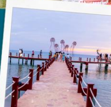
Sunset Sanato Beach Club