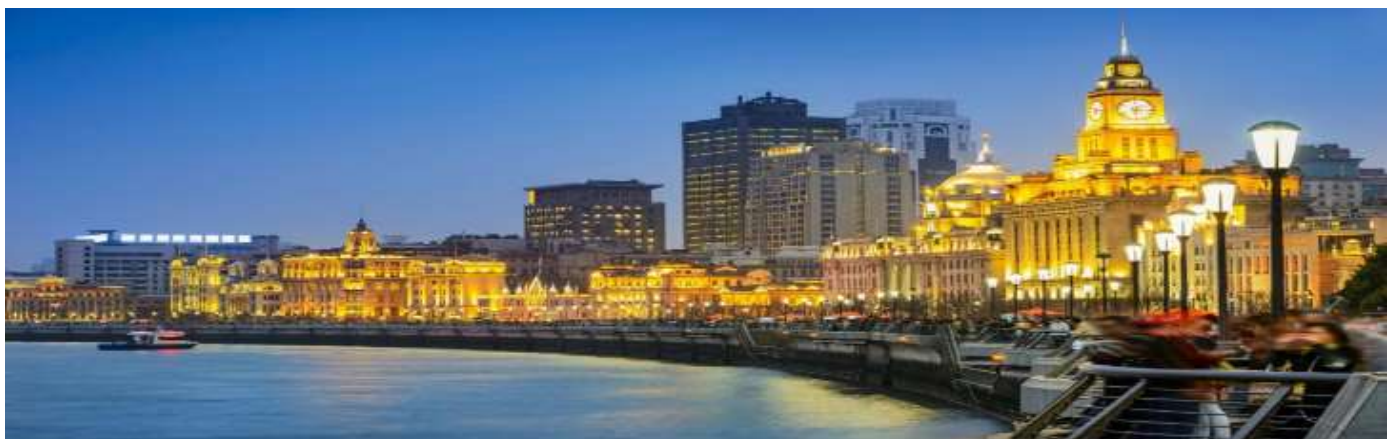
GO1PVG-CA005 ตะลอนเฉิงไฮ้ ปักกิ่ง 6วัน 4คืน (นั่งรถไฟความเร็วสูง) โดยสายการบิน Air China (CA)

07.00 น. เดินทางถึง ท่าอากาศยานนานาชาติเฉิงไฮ้ผู้ตงประเทศจีน เวลาท้องถิ่นเร็วกว่าประเทศไทย 1 ชั่วโมง (เพื่อความสะดวกในการนัดหมาย กรุณาปรับนาฬิกาของท่านเป็นเวลาท้องถิ่น) หลังจากท่านได้ผ่านพิธีการตรวจคนเข้าเมืองและศุลกากร