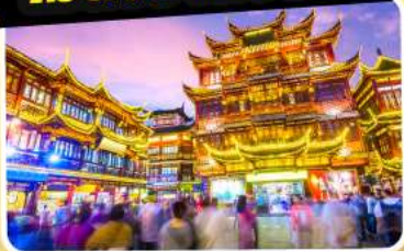
ตลาดร้อยปีเจิ้งหวิงเมี่ยว