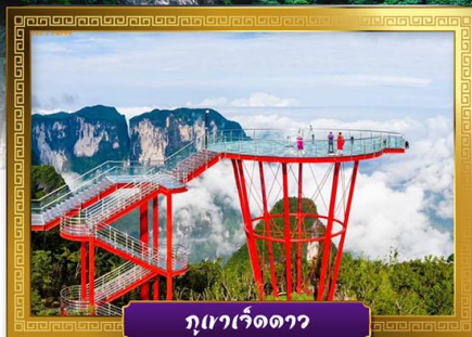
ภูเขารีดดาว

📍 เดินเล่นถนนคนเดินหวงซิงลู่และซีปู้เจีย