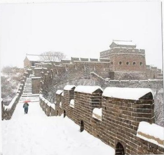
กำแพงเมืองจีน ด่านฉวิหยงกวน