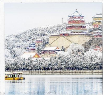
พระราชวังฤดูร้อน อวิเหอหยวน