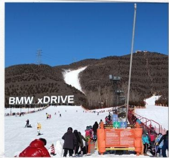
เล่นสกีจิวินตุซาน