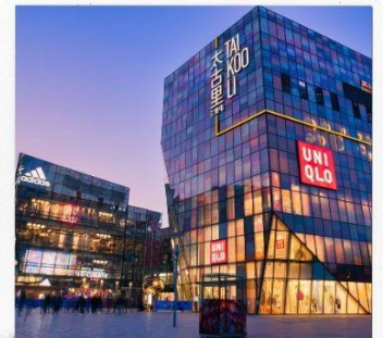
ชานหลี่กุน