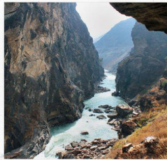
ช่องแคบเสือกระโดด