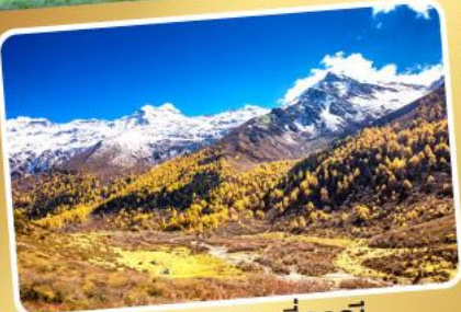
อุทยานภูเขาสี่ดรุณี